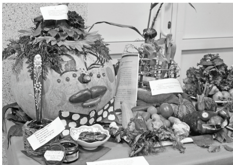
Да, похоже, вот эта гигантских размеров тыква признана сегодня королевой праздника!