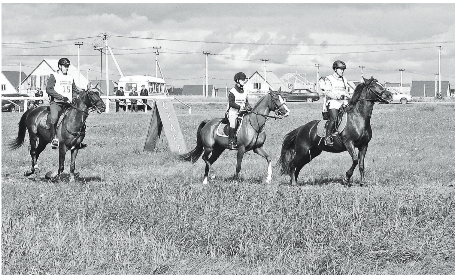
Старт дан. Участники забега на 45 км уходят на трассу.

Раннее утро, на часах 5:00, а на поле возле объездной дороги «Тюмень-Междуреченск» уже людно. Через несколько минут на старт уйдут участники 120-километровой дистанции. Волнение, ожидание, и... вперёд! Следом за ними – наездники на 80-километровую дистанцию.