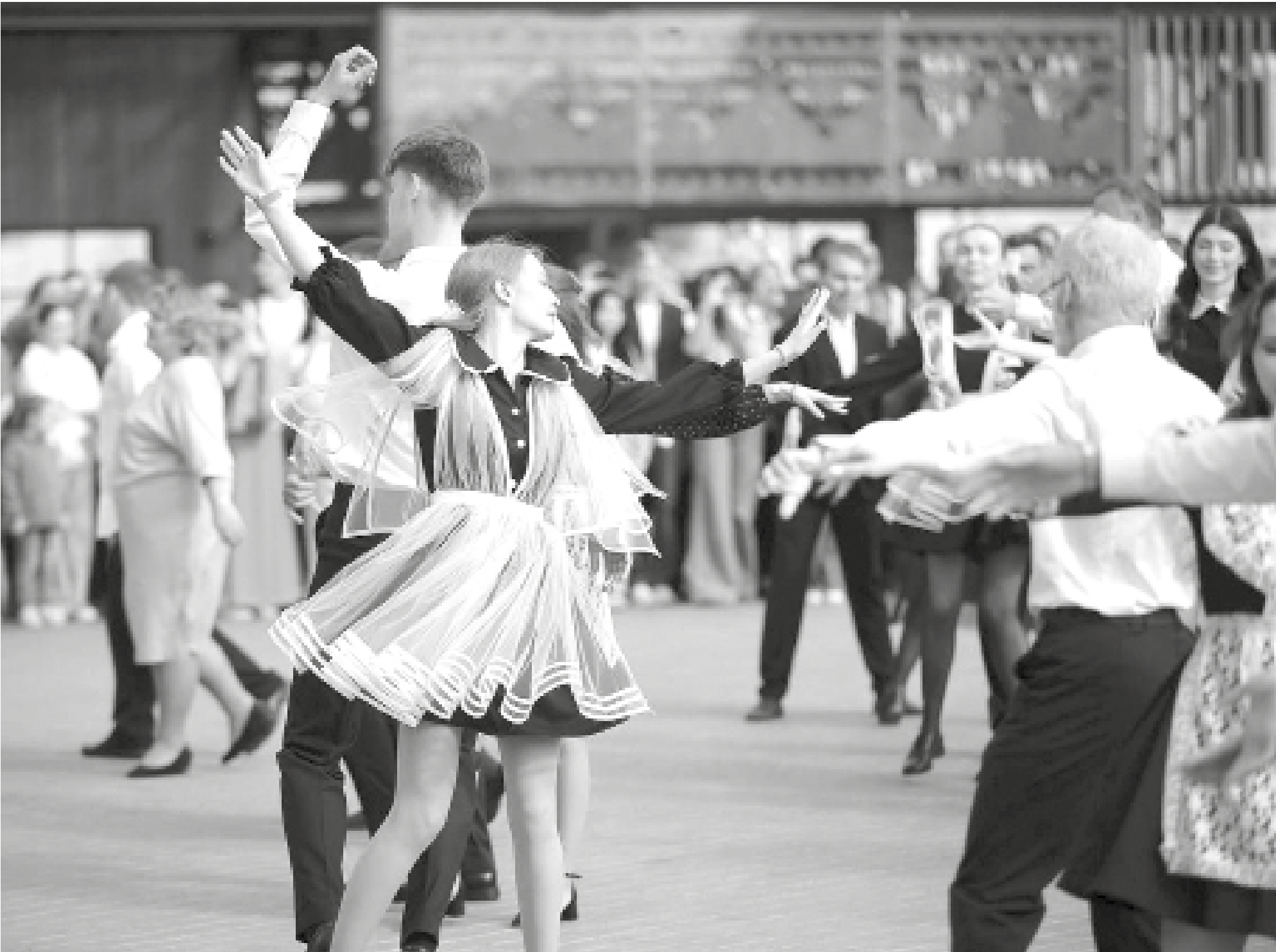
► Вальс закружил выпускников и их родителей