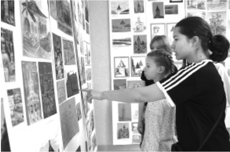
► Закрытие выставки прошло на улице Челюскинцев

На закрытие пленэра все его участники собрались в выста-