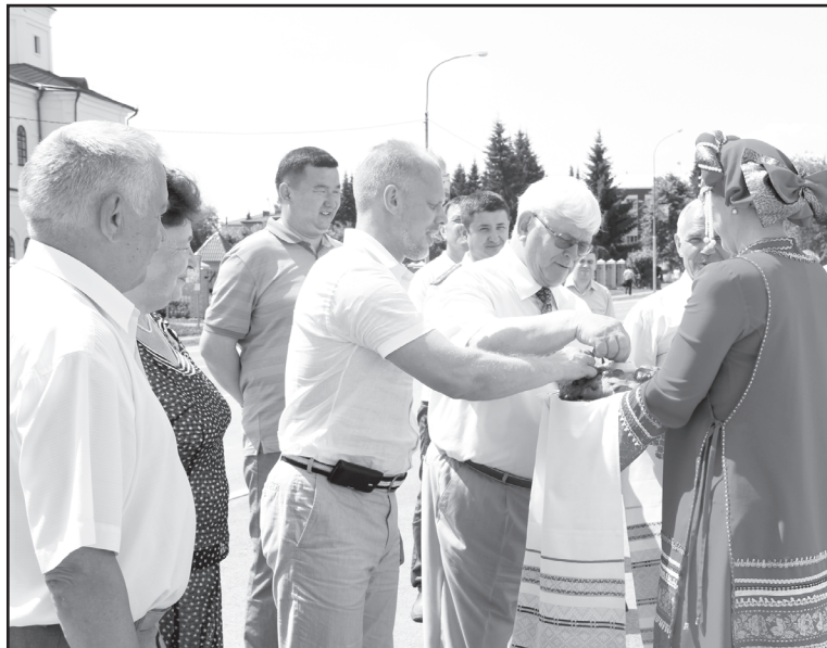
Хлеб-соль гостям Юргинского района

– Я в очередной раз убедился, что Тюменская область развивается сбалансированно. Наряду с социальными объектами развивается экономика АПК. Появляются новые предприятия, обновляется материальная база. Область обеспечивает себя полностью всем, что вырабатывает, что является самым главным критерием оценки результатов работы субъекта Федерации. Надо отдать должное органам местного самоуправления Тюменской области. Многие делается для комфортного проживания. Мне хочется, чтобы юргинцы и все жители области не останавливались на достигнутом, старались внедрять современные подходы и технологии.