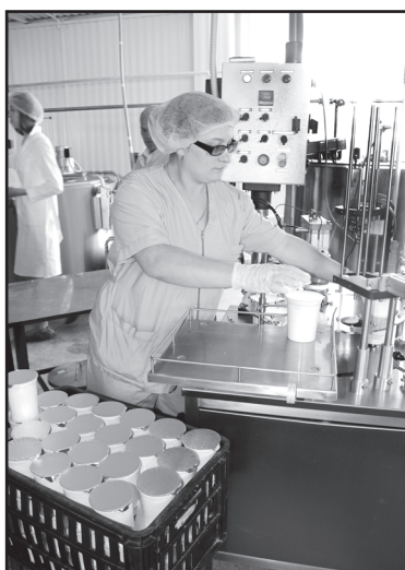
В цехе по переработке молока