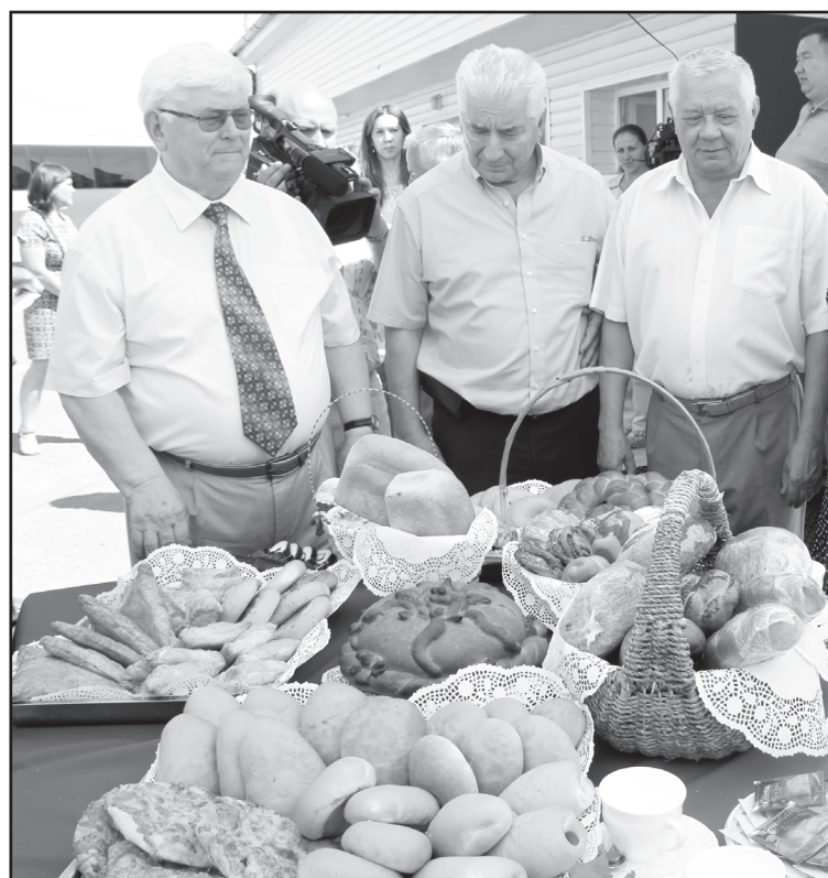
В ООО «Колос»