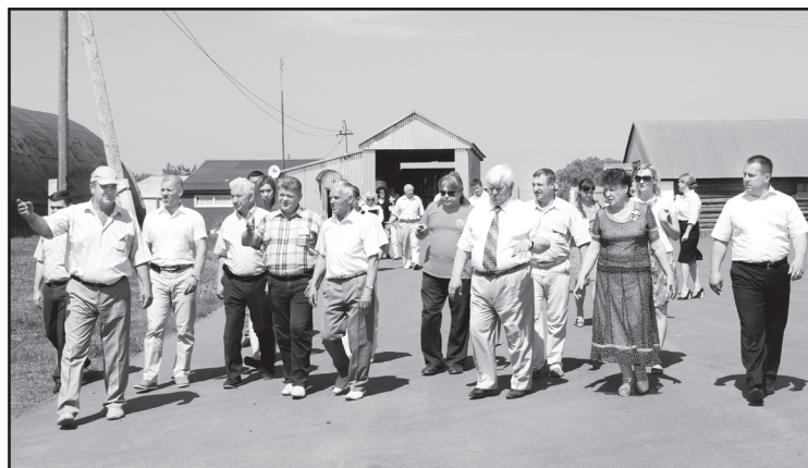
Второй адрес встреч – ООО «Земля»