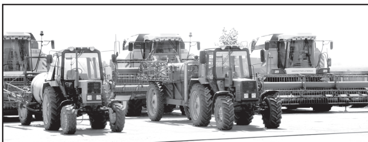
Предприятие отличается высокая техническая оснащённость