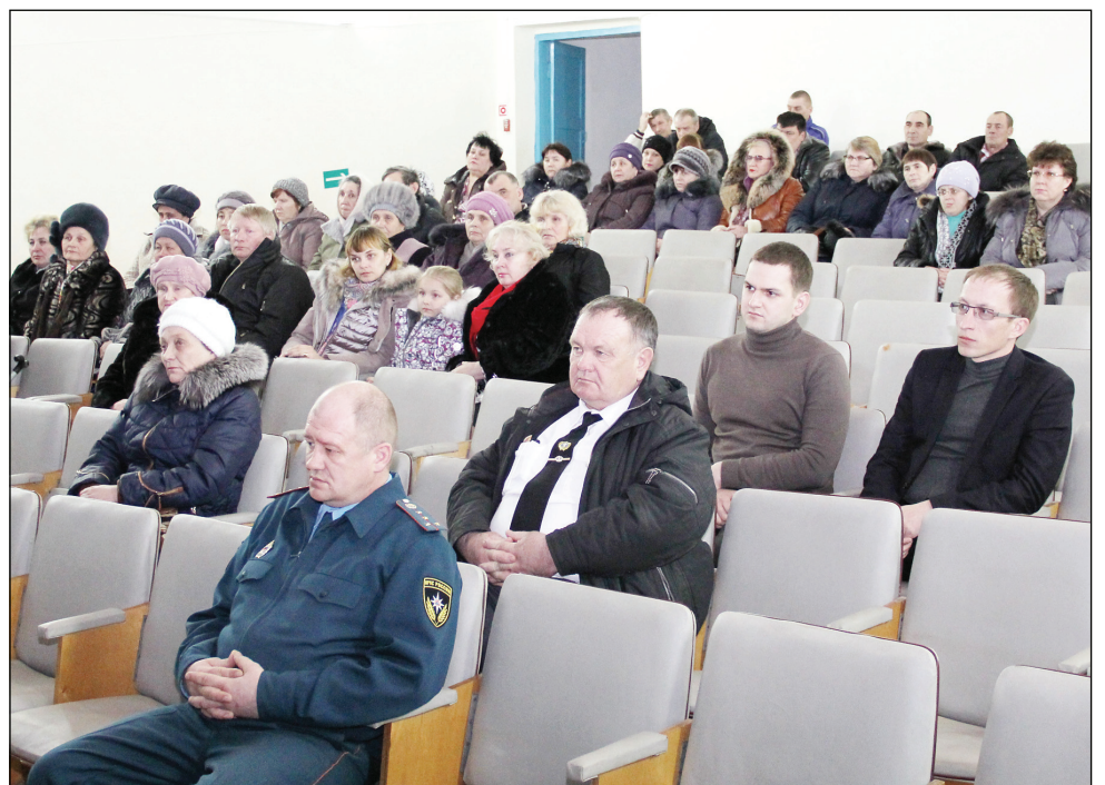
• Жители сельского поселения внимательно слушали выступления всех докладчиков.