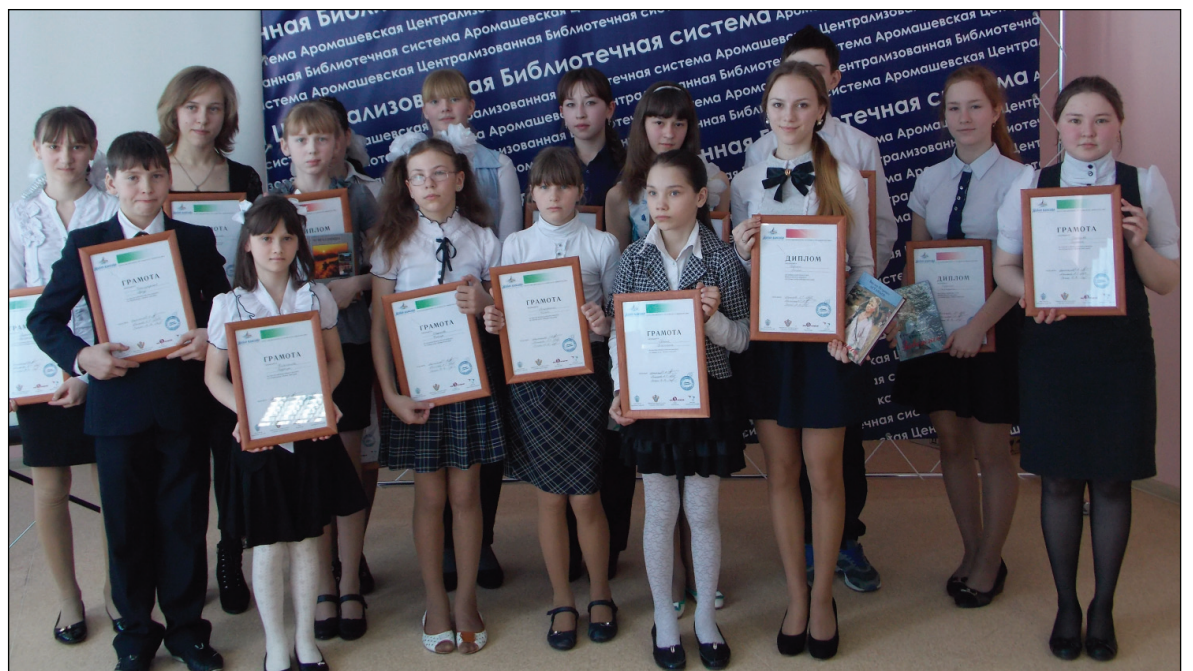
• Участники муниципального этапа Всероссийского конкурса чтецов «Живая классика».

23 марта в Аромашево подвели итоги муниципального этапа конкурса юных чтецов «Живая классика». 16 школьников в уютном зале Центральной районной библиотеки представили отрывки и монологи из отечественной классики, современной литературы и различных детских произведений.