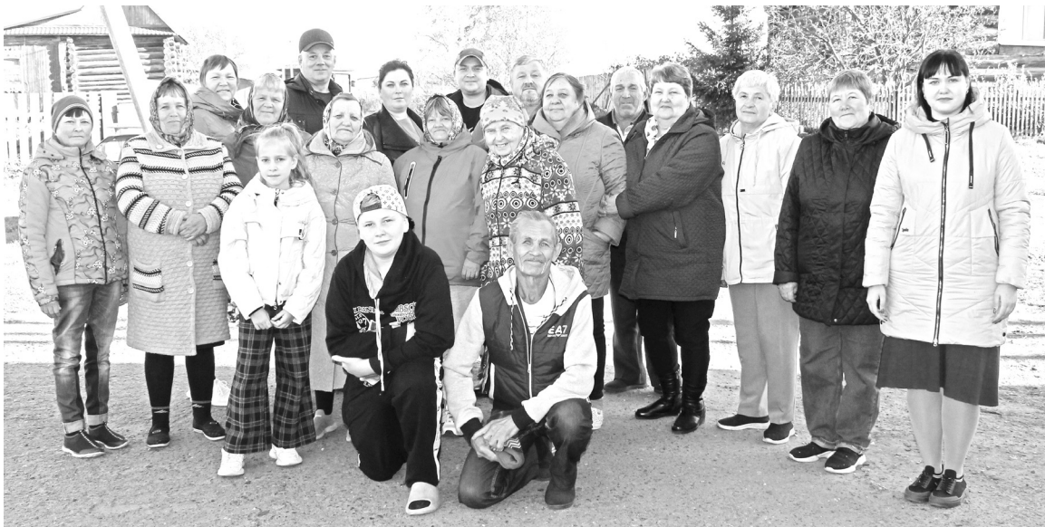
|| Традиционное фото с артистами.

Как известно, хорошее настроение - это основа долголетия. Тот живёт дольше, кто радуется и смеётся больше. У каждого своя «песнь» жизни. У многих пришедших на концерт за плечами суровая трудовая жизнь, годы лихолетия, испытаний и лишений. Однако они стойко переносили все невзгоды, не растеряв ощущения