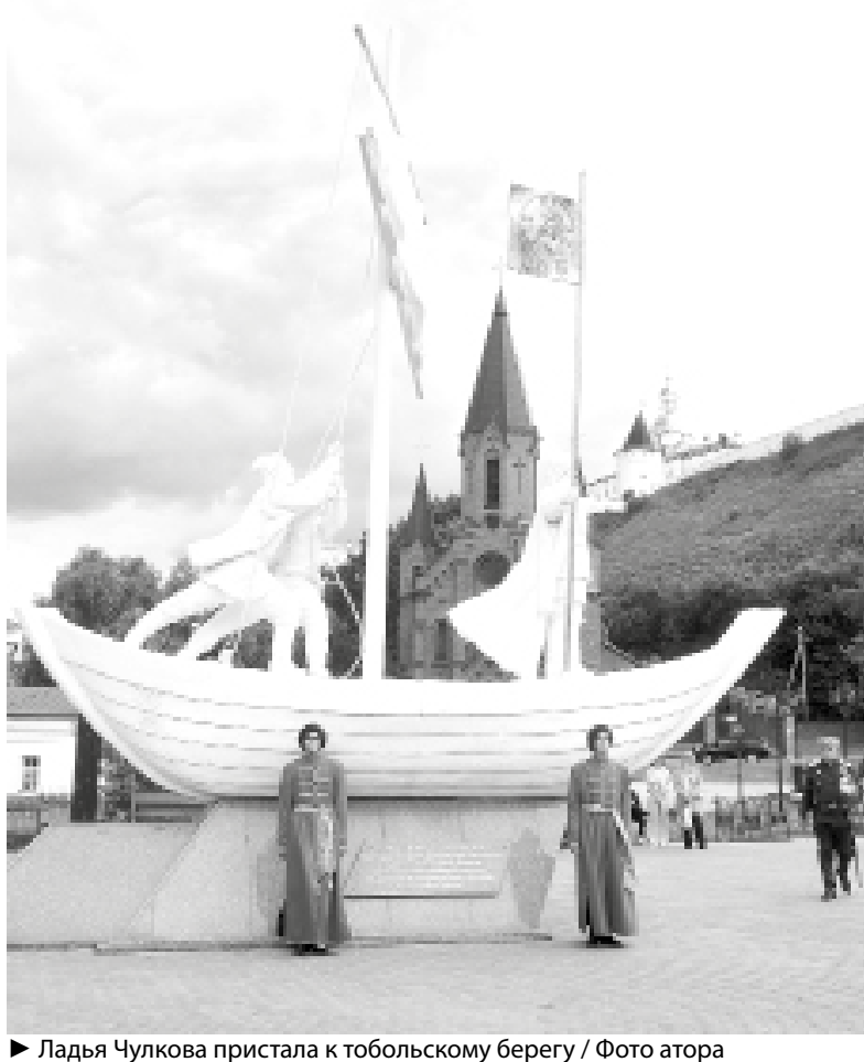
Ладья Чулкова пристала к тобольскому берегу

Праздничные мероприятия, посвящённые 438-летию Тобольска, продолжились в нижнем посаде