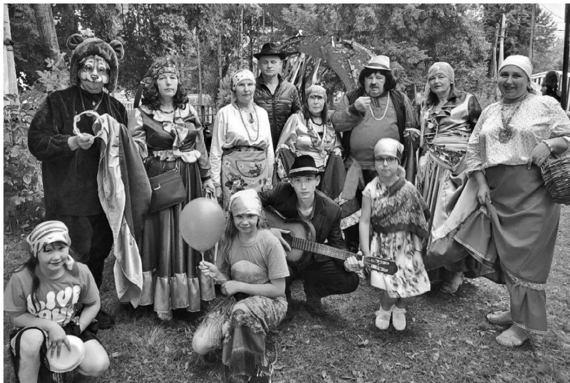
➤ Цыганское подворье