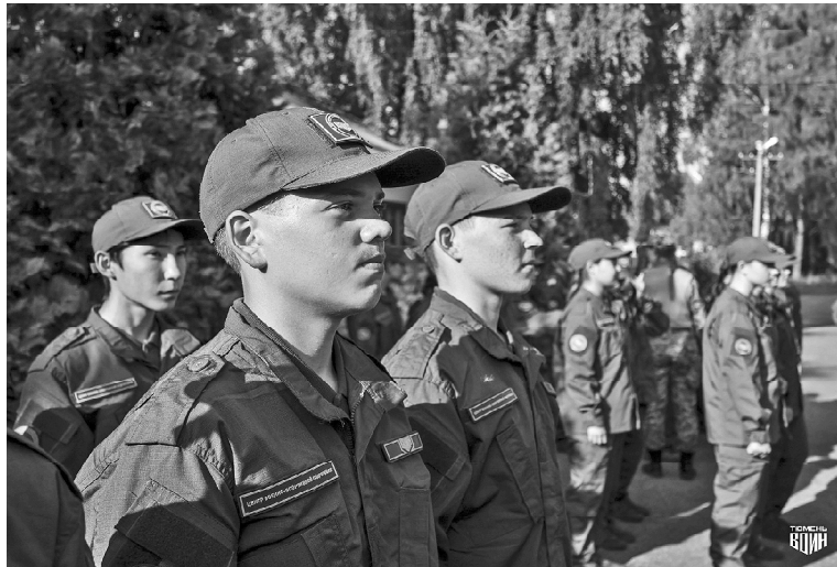
➤ Строевая подготовка, прыжки с вышки