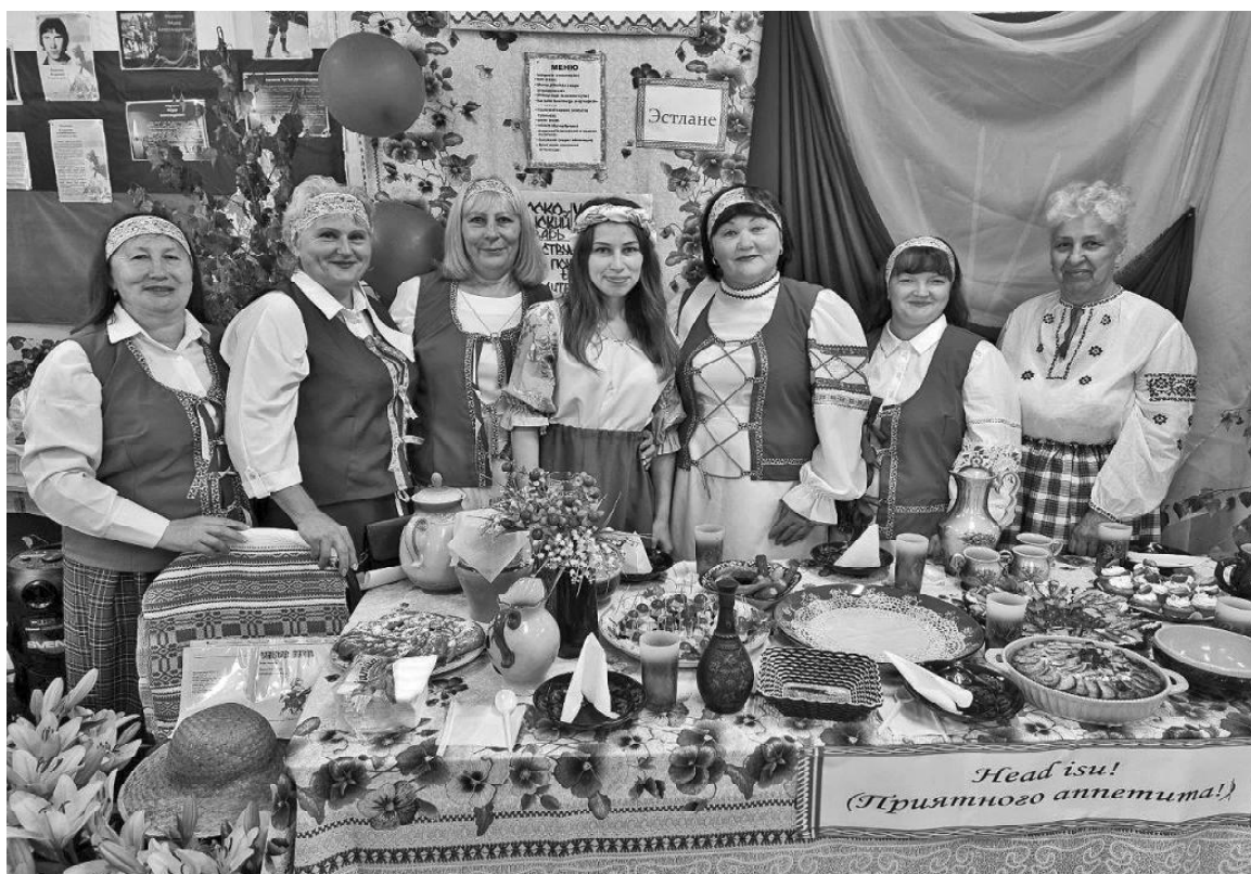
➤ Подворье «Эстонской культуры»

Село Коточи́ги издревле славилось мастерами да рукодельницами. По жеребьёвке, которая состоялась задолго до юбилея, село разбилось на три округа. Первый округ – улицы Юбилейная, Космонавтов, 50 лет Октября представили «Русскую культуру». Благодаря костюмам и кухне их локация превратилась в музей быта русской деревенской утвари и народного прикладного творчества. Всеобщему вниманию были представлены полотен-