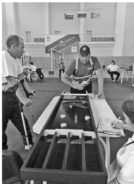
➤ Сергей Пфайф

Командам предстояло продемонстрировать ловкость, меткость и смекалку в пяти адаптированных настольных играх, предназначенных для людей с ограниченными возможностями здоровья: новусе (игра с элементами соревнования, суть которой: забить пешки противника в одну из четырёх луз, используя вместо шаров); джак-коло (цель игры – первым закатить все