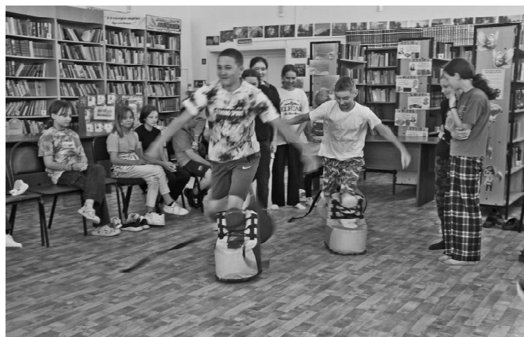
➤ Пришкольный лагерь в с. Балаганы