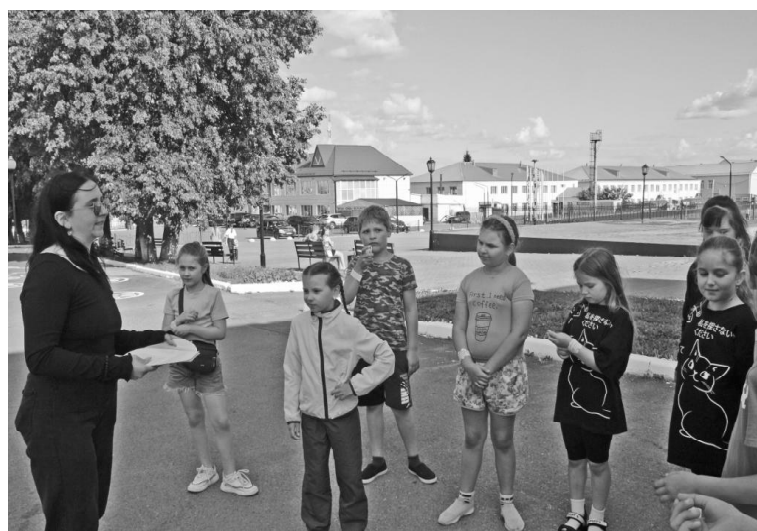
➤ Вечерняя площадка для детей при РДК

Выпуск полосы осуществлён при финансовой поддержке Министерства цифрового развития, связи и массовых коммуникаций Российской Федерации