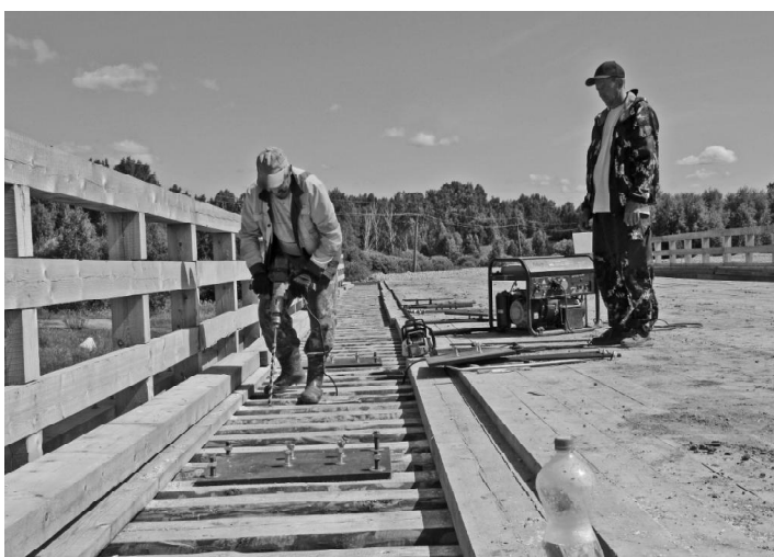
➤ Закладка барьерного сооружения