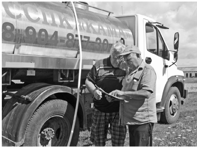
➤ Идёт отправка молока