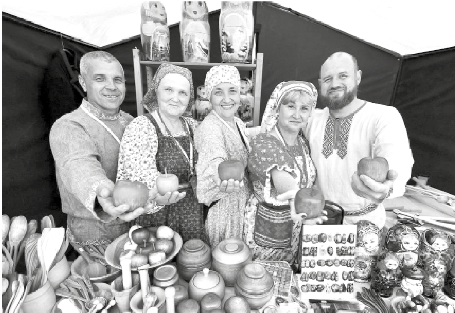
► Хороши яблоки у делегации из Верхотурья, жаль, деревянные!

«Это уже третий по счёту фестиваль, который проходит благодаря грантовой поддержке СИБУРа по программе социальных инвестиций «Формула хороших дел». В этом году к нам присоединились умельцы не только из Тюменской области, но и из Омска, Ханты-Мансийского автономного округа, Свердловской области и других регионов – более 80 мастеров представляют свои уникальные работы. На нашем фестивале всегда атмосферно, душевно и по-сибирски гостеприимно! Цель фестиваля – поддержать наших мастеров, сохранить традиции и оставить новые