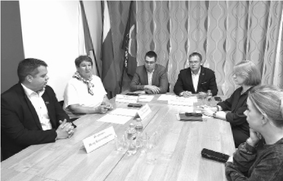
► Встреча в общественной приёмной