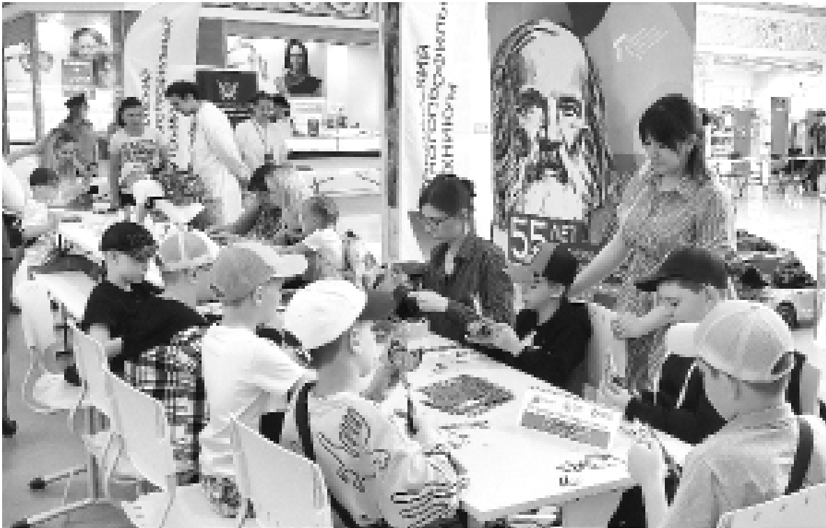
► Дети не отходили от столов с мастер-классами