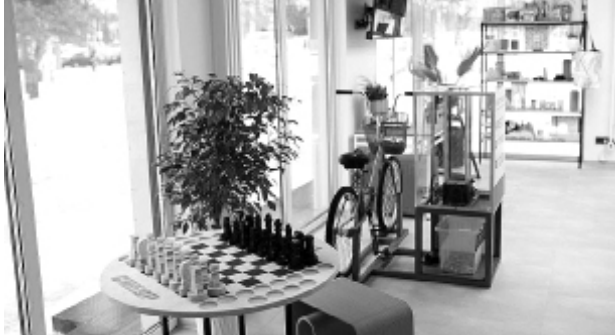
► Экодом «Менделеев»

В Тобольске экодома расположены в 7 «а» (стр. 45, экодом «Спортивный») и в 6 микрорайоне (площадь имени Менделеева, экодом «Менделеев»). Помимо этого, принять участие в БумБатле можно и воспользовавшись другими пунктами раздельного сбора отходов. Найти ближайший можно на официальном сайте акции сайт бумбатл.рф.