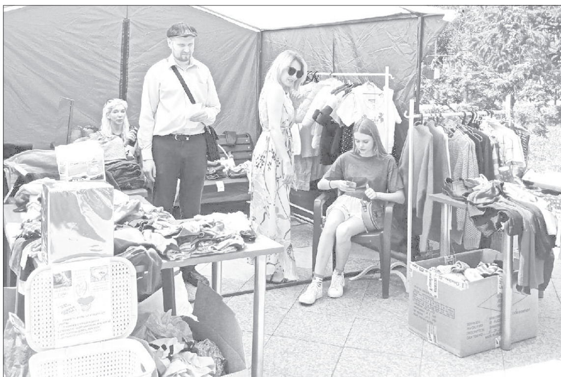
Вещи лежали аккуратными стопками на столах и в коробках, висели на вешалках. Их было удобно рассматривать, чтобы определиться с фасоном и размером

На фестивале всеобщее внимание было приковано к одной