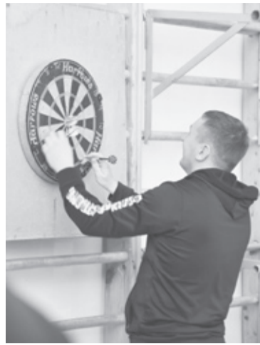
|| Фото автора

Виталий признаётся, что особых навыков обращения с