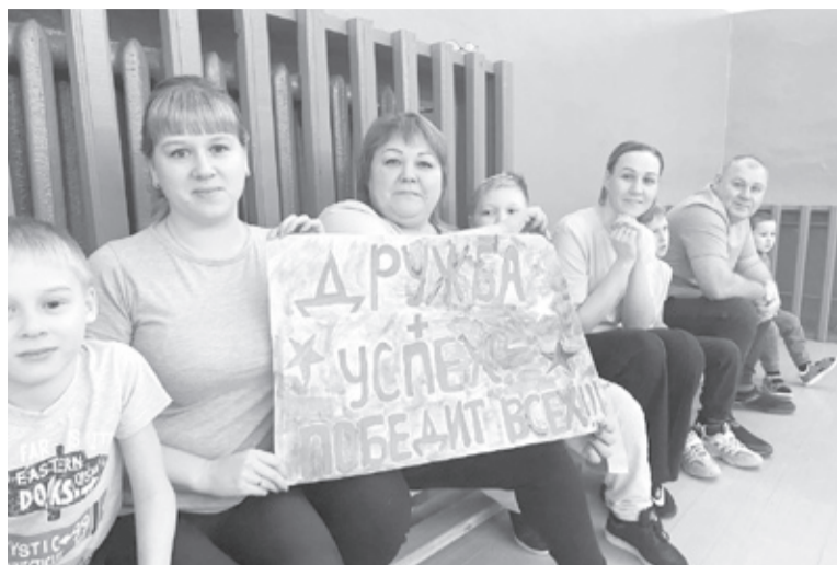
|| Фото автора