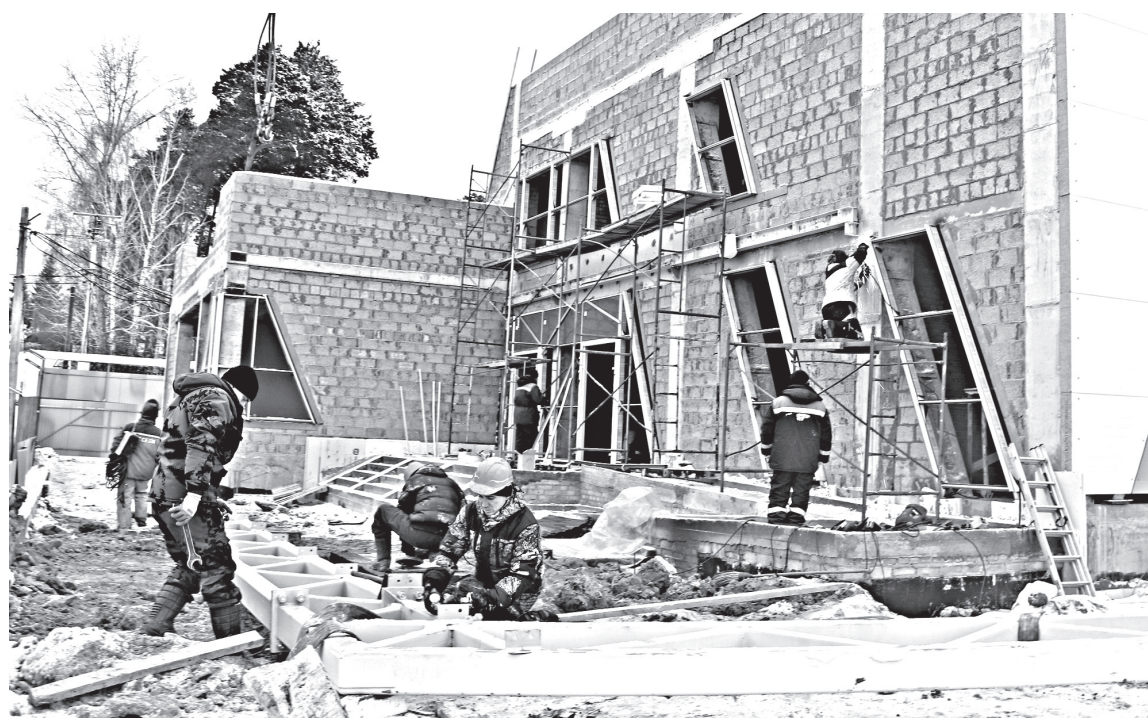
• Порядка четырёх десятков человек трудится сегодня на стройплощадке. Среди них машинисты, трактористы, монтажники, сварщики, кровельщики.

Строители уже соорудили вокруг здания подпорную стену, сделали отделку подвальных помещений, возвели крыльцо и установили металлический козырёк над главным входом. Недавно в здании появился свет – компания «СУЭНКО» подвела к бассейну наружные электросети. К спортивному объекту уже протянут водопровод. Постро-