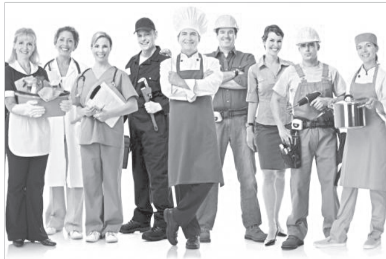
В центре занятости населения не только предлагают вакансии, но и помогут получить новую специальность