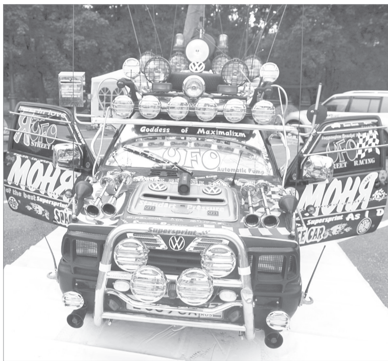
Автоладельцам за тюнинг без документов грозит штраф, а машину могут даже снять с регистрации

По их словам, апробация изменений в конструкцию автомобиля регулируется Техническим регламентом Таможенного союза «О безопасности колесных транспортных средств». Повторная же регистрация доработанного автомобиля проводится ГИБДД на основании докумен-