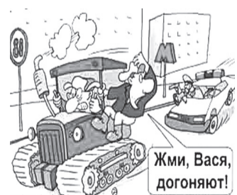
cartoon.kulichki.com /рисунки Евгения Крана/

Аналогичное наказание может получить и другой угонщик, который выбрал для «покатушек» более диковинный транспорт. На тракторе скоростные заезды с уходом от погони особо не устраивай, потому-то у сотрудников ГИБДД ушло немного времени на поимку 34-летнего «шумахера».