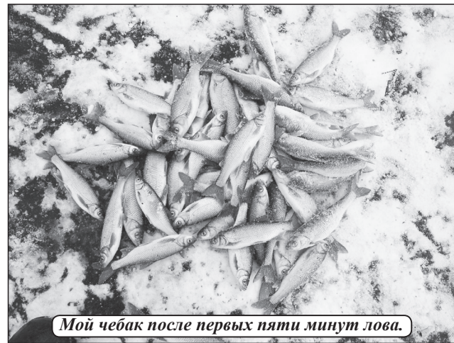
Мой чебак после первых пяти минут лова.

В его прокуренной малухе весь стол занимала огромная карта Упоровского района. Обширные зелёные поля чередовались с перелесками, сосновыми борами, озёрами и болотами. А через всё это природное многообразие голубыми жилками струились многочисленные малые и не очень малые реки и речушки.