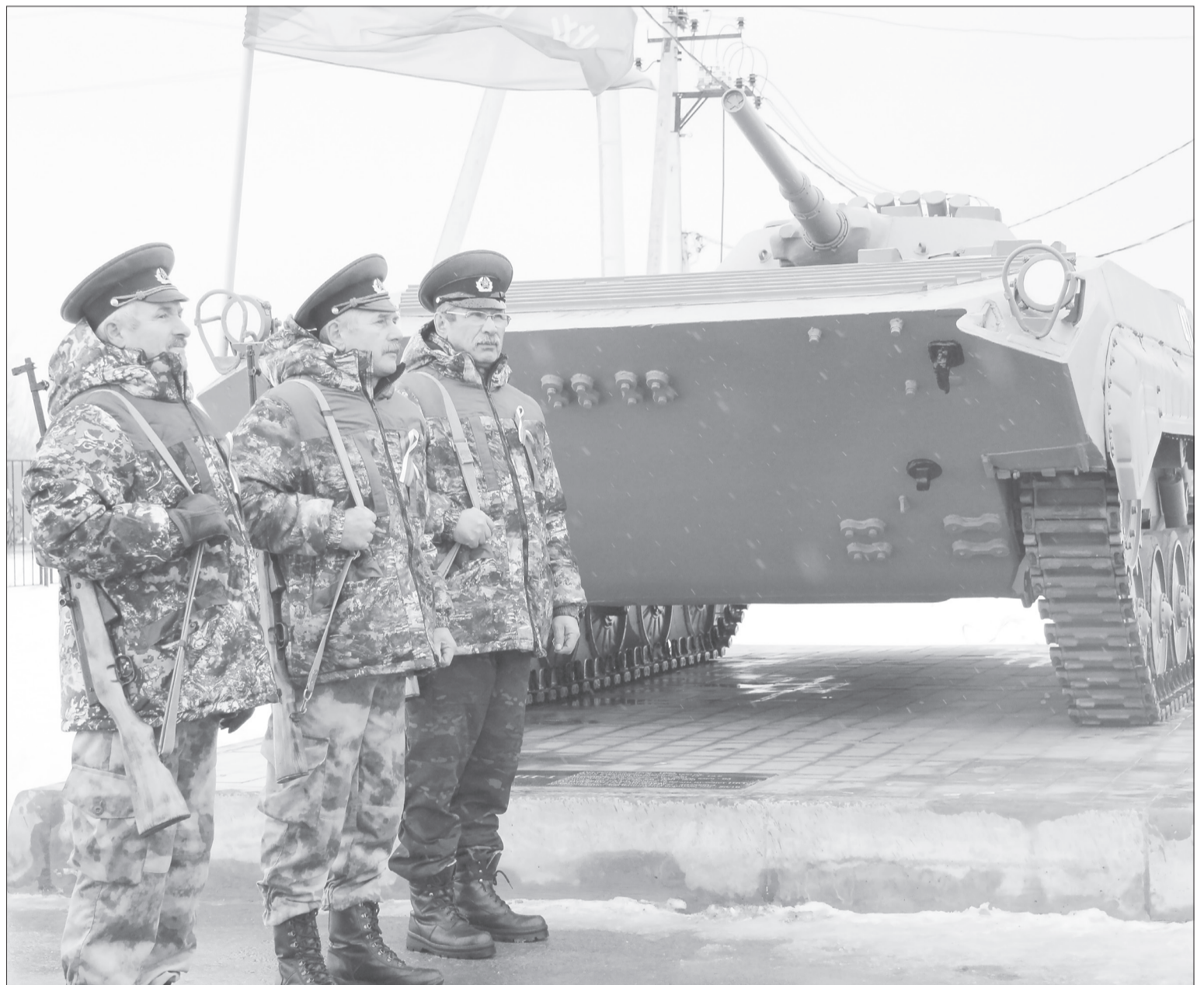
Ветераны-пограничники встали в почётный караул, а затем дали троекратный залп в небо