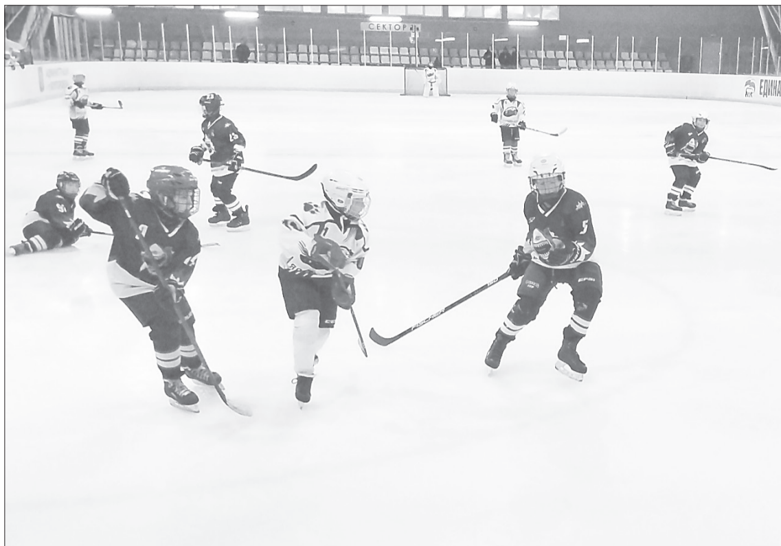
Выйти один на один с вратарём винзилинских соперников нашим хоккеистам в белом удавалось редко

Энтузиазм ялуторовчан был вознаграждён вторым местом турнира, это хорошая позиция и вполне реальная оценка возможностей нашей команды. На первом - винзилинские «Акулы», на третьем - заводоуковская «Спарта».