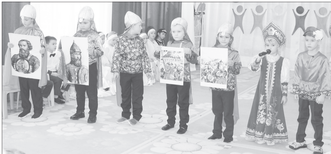
О ратных достижениях русского воинства рассказали непосредственно богатыри

- Мы показываем детям убранство деревенского дома, а потом играем с ними в традиционные игры «Гори, гори ясно!» и «Вейся, капуста!», - рассказала художественный