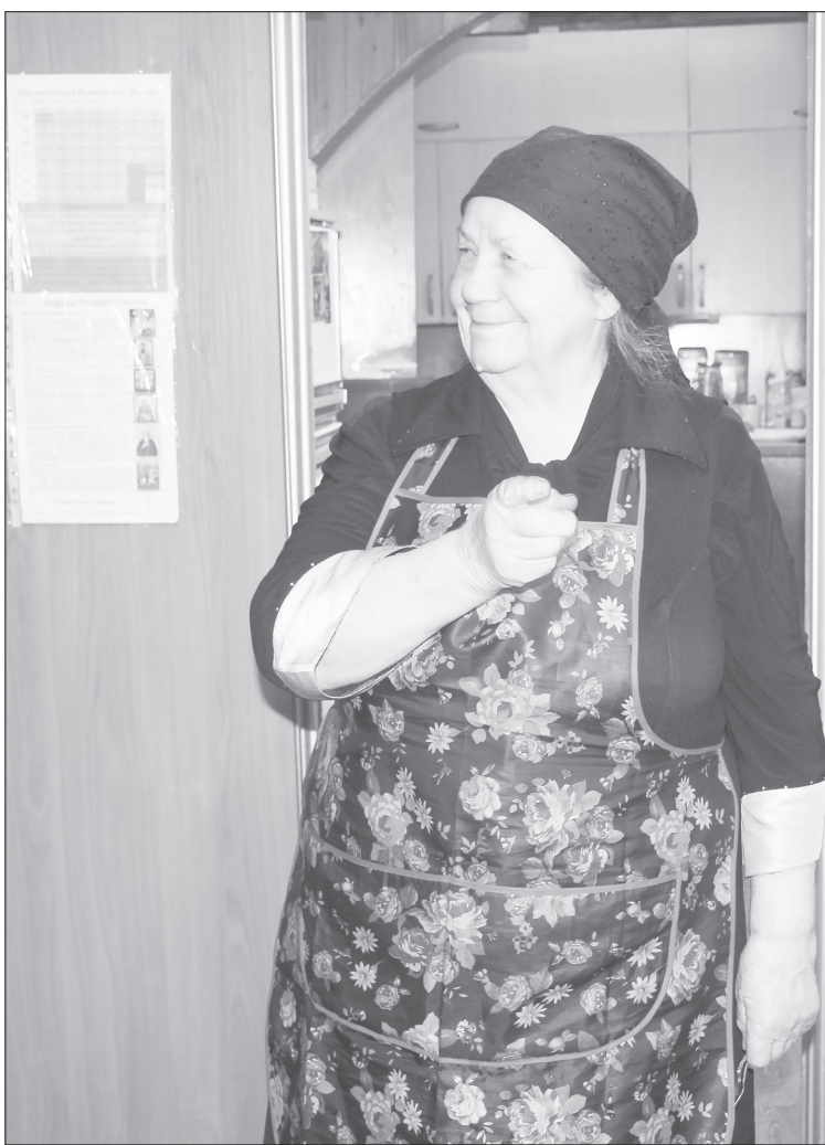
Главная хозяйка трапезной Успенско-Никольской церкви всегда радуется Великому посту и соблюдает его

Не унывать! Мы в трапезной улыбаемся, не ходим с унылыми лицами, а радуемся посту. Живём так же, только ещё больше любви в это время проявляем, заботимся друг о друге. Идут к нам в основном послушники, а служба каждый день в первую неделю поста утром и вечером, подкрепляться надо и телесно! Варим терпкий насыщенный компот, чтобы сил у человека прибавилось, много овощей готовим. Мы же сразу от обильной Масленицы перешли в пост, немножко тяжело. Некоторым приходится несколько раз в день между службами чаю попить или поесть постного. По выходным разрешается растительное масло, тогда уже салаты с выпечкой делаем. Люди довольны. Вот вы неделю попуститесь, так тоже маслу растительному обрадуетесь. И вообще, если кто выдерживает этот пост, то рад, что может свои страсти побороть. А не выдержал - не страшно, но нужно покаяться, почаще ходить на исповедь и причащаться.