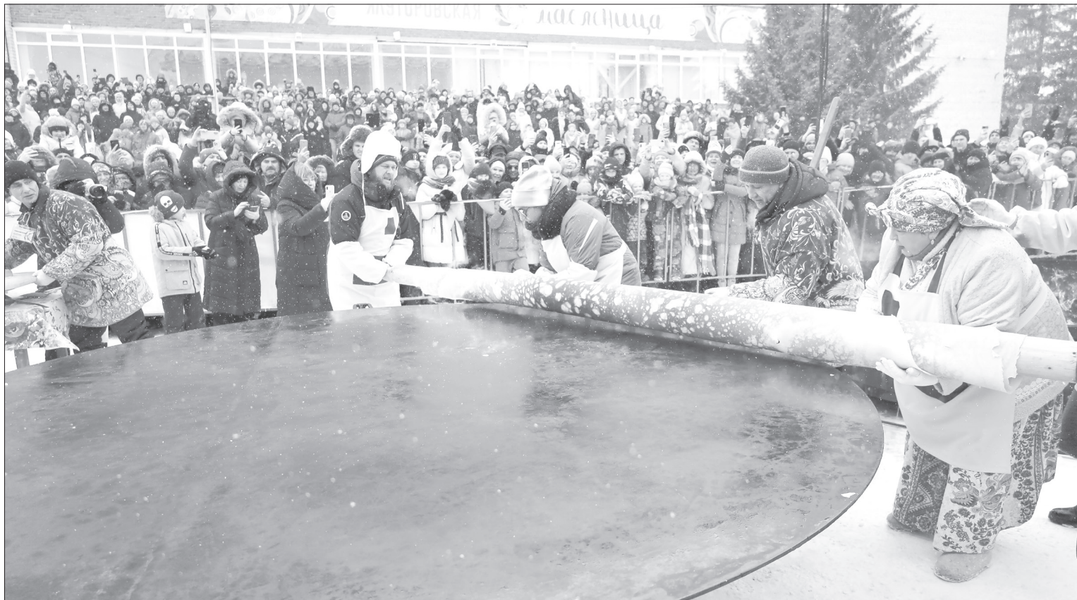
Площадка битвы блинопёков с трудом вмещает растущее год от года количество зрителей