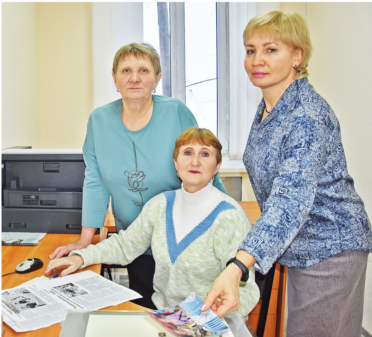
Сотрудники редакции работают над очередным номером газеты

Сельские газеты играют важную роль в информационном пространстве. Они продолжают оставаться одним из основных источников получения данных о происходящем в районе, служат средством общения людей, способствуют укреплению связей между жителями.