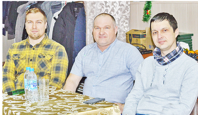
Энергичные предпринимательские казанцы трудятся на благо земляков, поднимая престиж территории

В ходе мероприятия предприниматели обсудили вопросы га-