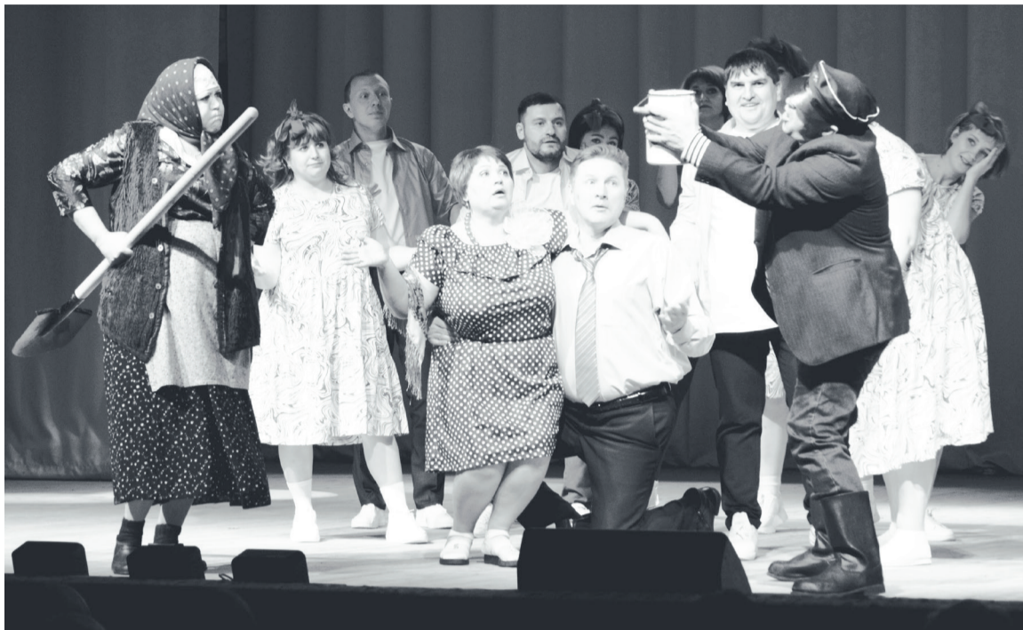
Театрализованный танец бызовского коллектива зрителям очень понравился.

Яркое трёхчасовое представление пролетело незаметно. Более длительным показалось ожидание оглашения результатов конкурса. И пока члены жюри совещались, зрители в зале делились впечатлениями. По мнению гостей мероприятия, уровень подготовки коллективов с каждым годом становится выше и выбрать лучших становится труднее, но любимцы у публики всё равно определились. Многим пришёлся по душе живой театрализованный номер с элементами хореографии коллектива «Сударь и сударушки» по мотивам фильма «Любовь и голуби» и