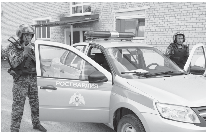
Экипаж вневедомственной охраны Росгвардии на маршруте патрулирования