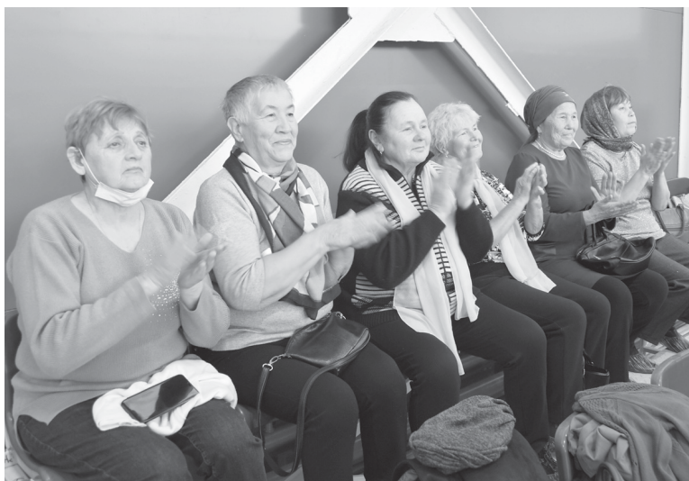
Наши пенсионеры – активные участники множества мероприятий, проводимых в Ярковом районе

Выступление директора Комплексного центра социального