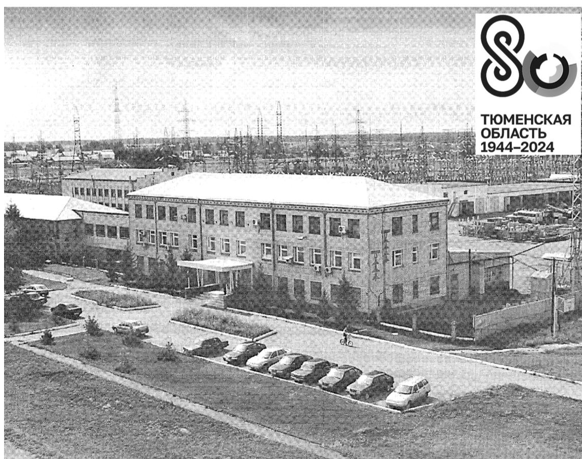
• На тихой окраине Заводоуковска в 1983 году началось строительство производственной базы Южных электрических сетей. Сегодня предприятие обеспечивает энергией девять районов области.

Сегодня это предприятие называется Южное территориально-производственное отделение