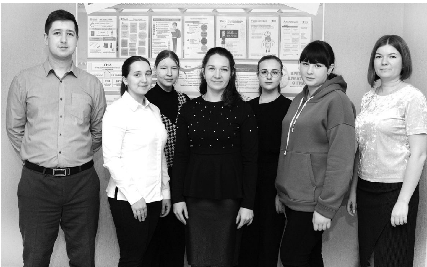
Участники интерактивной бизнес-игры «Лучок 2.0» получили уникальный опыт

В этом учебном году молодые педагоги и учащиеся Омутинской средней школы № 2 приняли участие в первом уровне образовательной программы «SMART-кооперация» - интерактивной бизнес-игре «Лучок 2.0». Ее организаторами являлись Западно-Сибирский союз производителей и переработчиков органической продукции «Биопродукт» и Государственный аграрный университет Северного Зауралья.