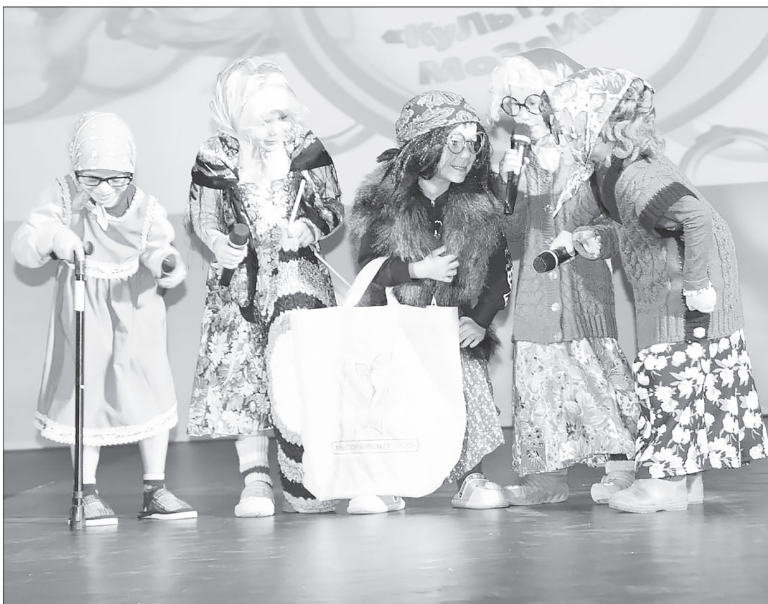
■ Пока еще детсадовцы, но уже яркие звездочки творческого небосклона нашего района.