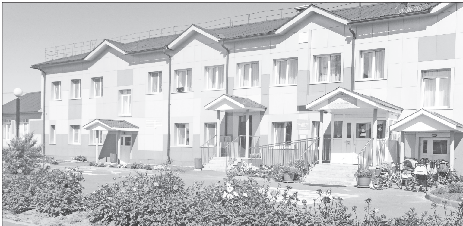
В такой современной сказке воспитываются юные нижнетавдинцы.