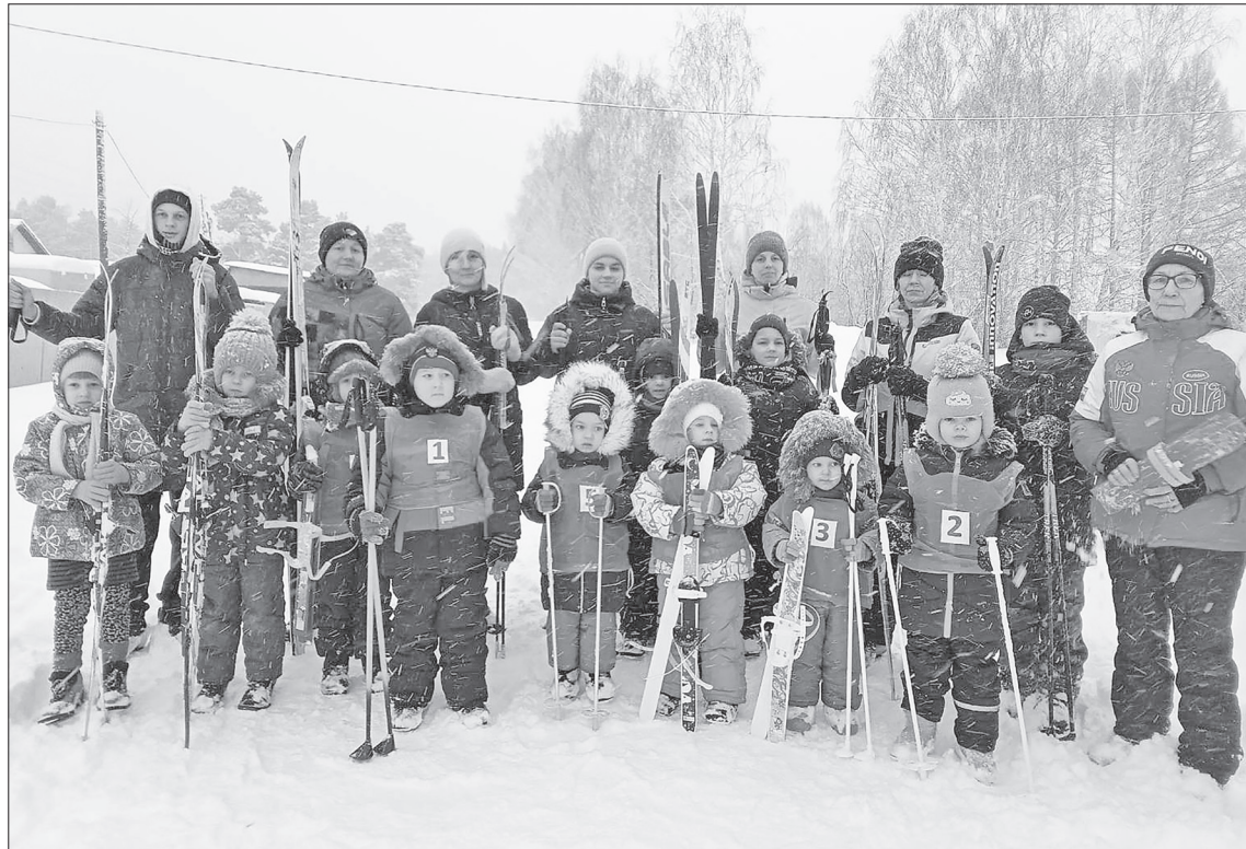
Дружная команда черепановцев на «Лыжне России».

Ходить на лыжах здесь начинают обучать с самых малых лет. Занимается с ребятами тренер по физ-