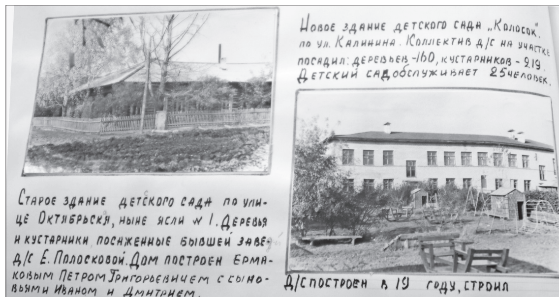
Детский сад «Колосок» до капитального ремонта.

отзывчивыми, чуткими и внимательными к детям. Проводили вечера развлечений и утренники, которые в то время проводились в вечерние часы при зажжённых свечах. В новогодние праздники ёлку украшали игрушками-самоделками, которые готовил весь коллектив, дети и родители. Из магазина игрушек было очень мало».