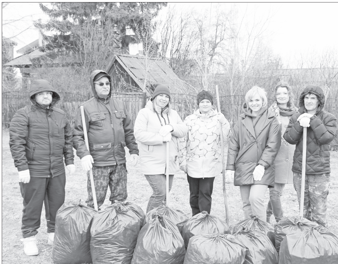
Сотрудники администрации Нижнетавдинского района на очередном экологическом субботнике.

большое значение уделяется озеленению территории нашего района. В период действия национального проекта «Экология» это особенно актуально.