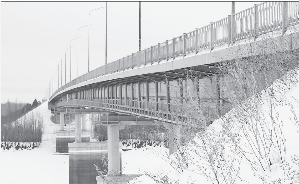
Современный мост обеспечил беспрепятственное сообщение между населёнными пунктами Нижнетавдинского района.

Вспоминаем, как берега Тавды соединялись вчера и сегодня