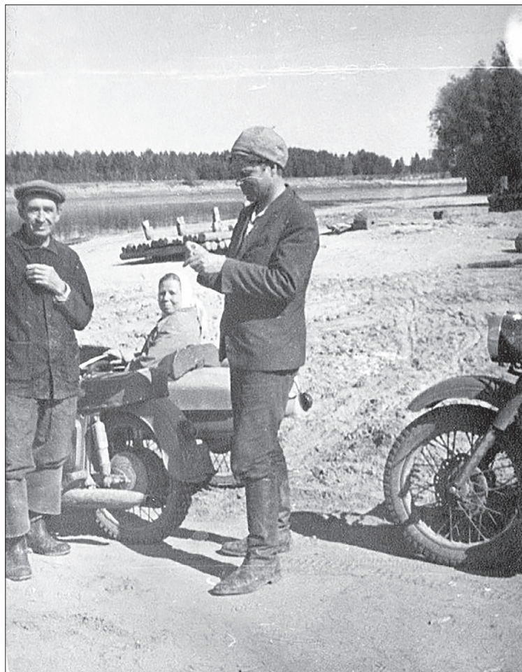
Фотография 1972 года показывает, как люди ждут переправы на другой берег Тавды.