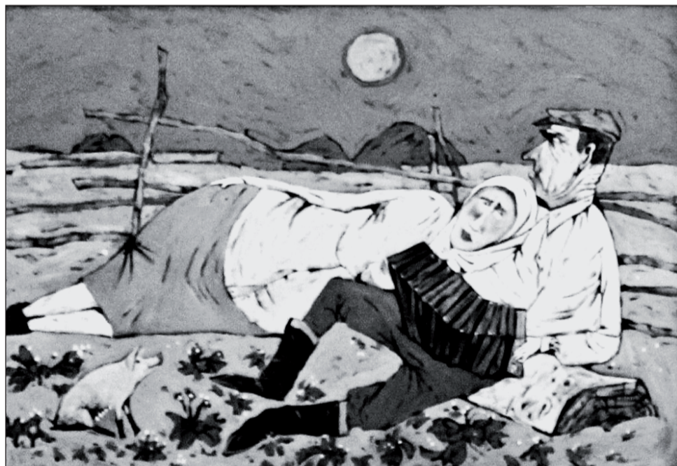
Окрасился месяц багрянцем (2011 г.).