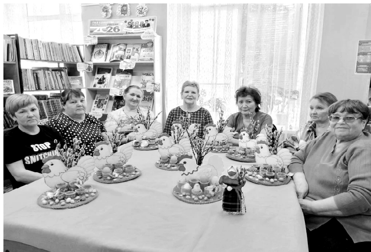
› В клубе рукоделия, с. Сартам