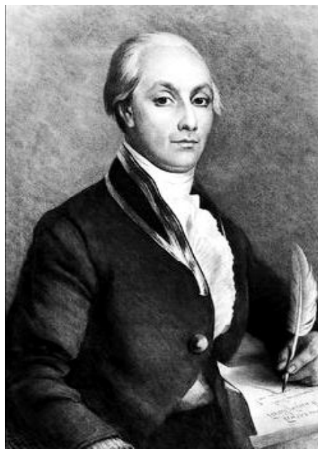
► Александр Николаевич Радищев

Я тот же, что и был, и буду весь мой век. Не скот, не дерево, не раб, но человек!