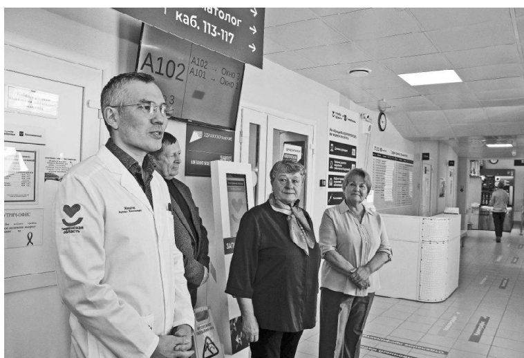
➤ Народная комиссия в поликлинике