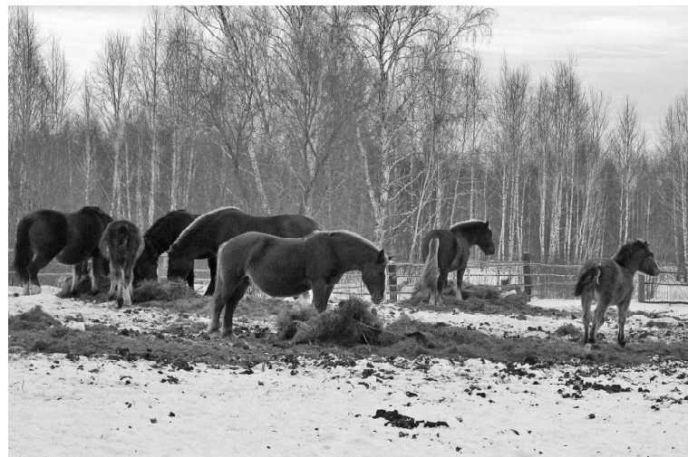
➤ Личное подсобное хозяйство