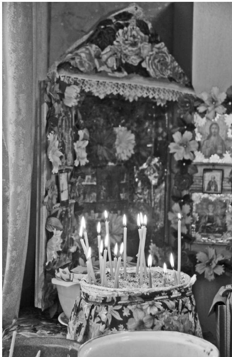
➤ Икона «Воскресение Христово»