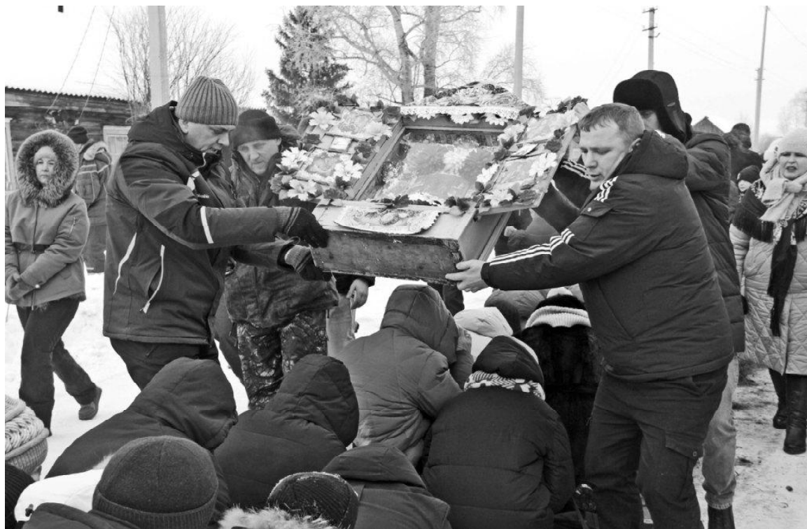
➤ Моменты обряда переноса иконы «Воскресение Христово»