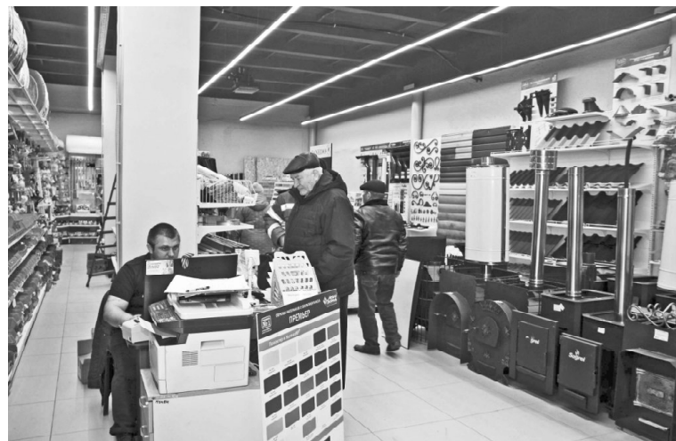
► В «АвтоСити» // Фото Татьяны СУХОВОЙ