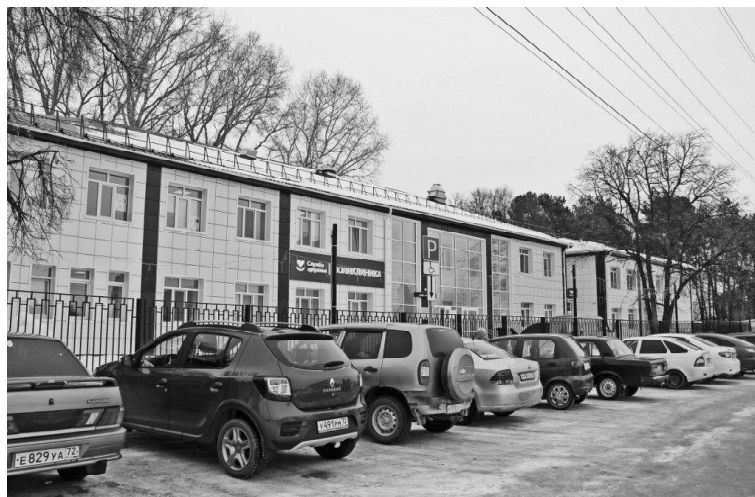
➤ На парковке