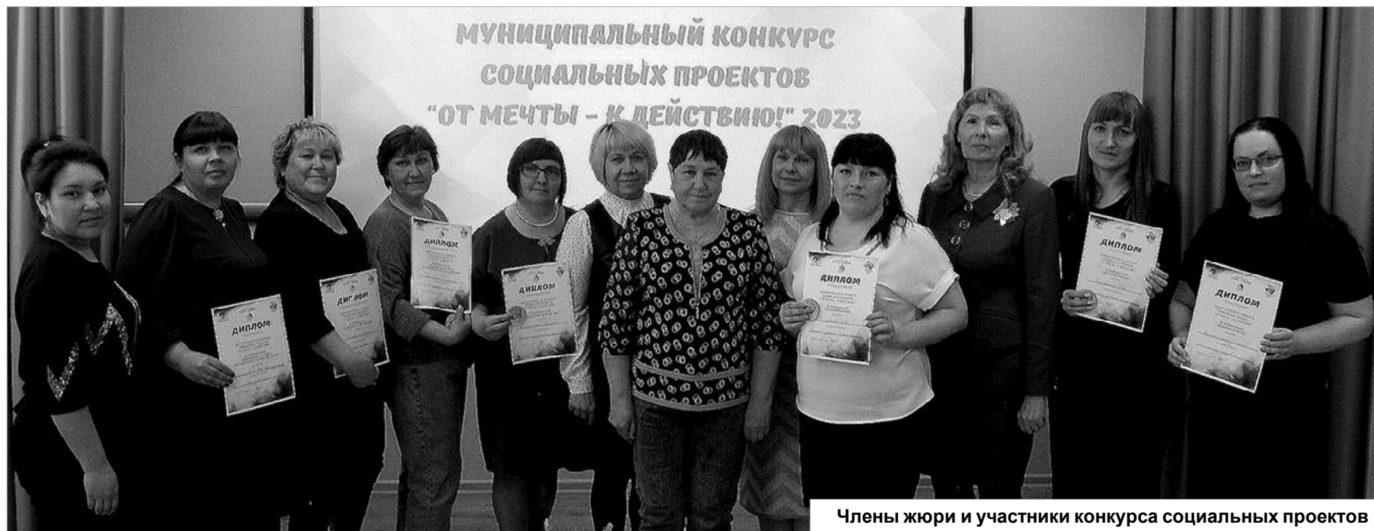
Члены жюри и участники конкурса социальных проектов