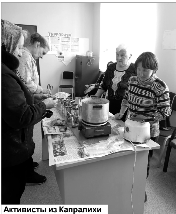
Активисты из Капралихи

За последнюю неделю, благодаря финансовой помощи неравнодушных армизонцев, удалось приобрести и передать в зону СВО довольно дорогую, но нужную вещь — дизельный генератор. Помимо этого, приобретались и отправлялись (в том числе — с бойцами, приходившими в краткосрочные отпуски) продукты, оборудование, спецтехника, лекарственные препараты, одежда.