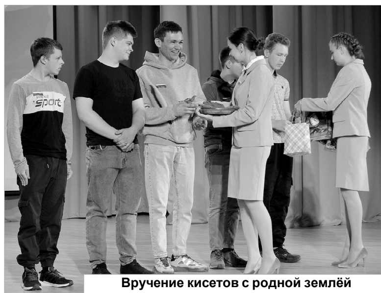
Вручение кисетов с родной землёй

призыву и при её прохождении сам заключил контракт. Это — дело добровольное!