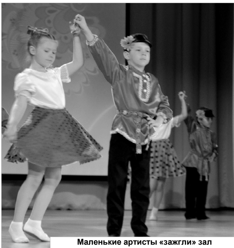
Маленькие артисты «зажгли» зал