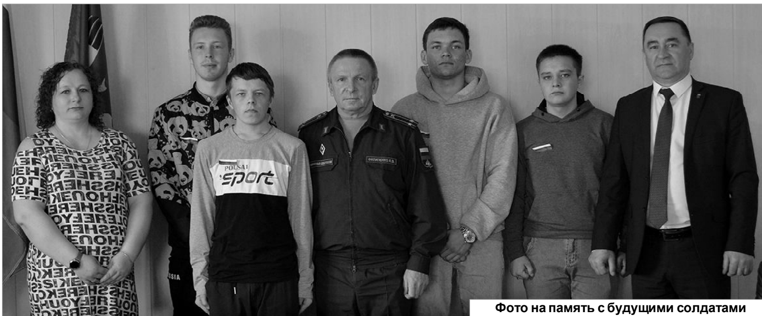
Фото на память с будущими солдатами