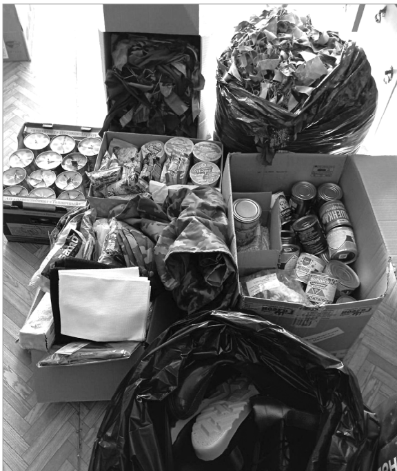
Этот «набор» уже отправлен в зону СВО