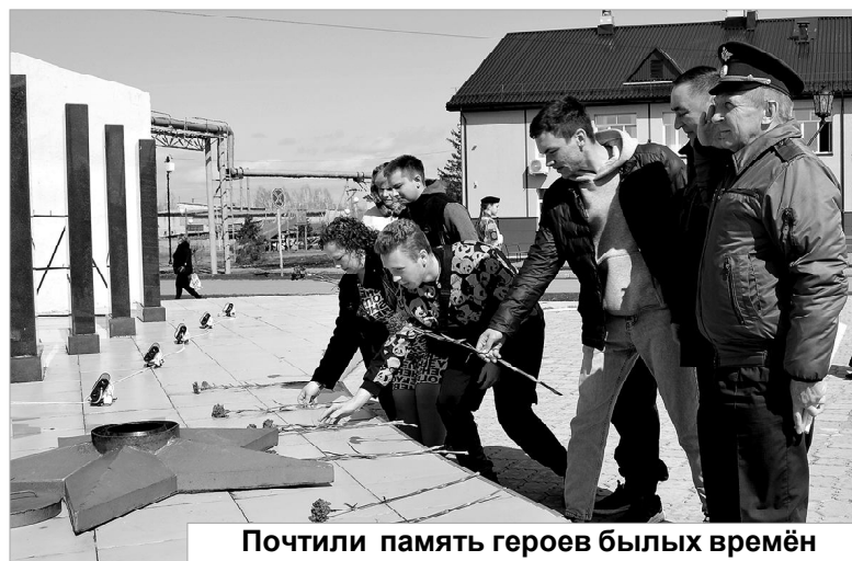
Почтили память героев былых времён

— Да, каждый «срочник» получит банковскую карту, куда будет перечисляться денежное довольствие — от 2000 до 15000 рублей. Сумма выплаты будет зависеть от воинского звания, должности и места прохождения службы... Отмечу, никто из призывников участвовать в зоне спецоперации на Украине не будет! За исключением тех, кто был призван на военную службу по