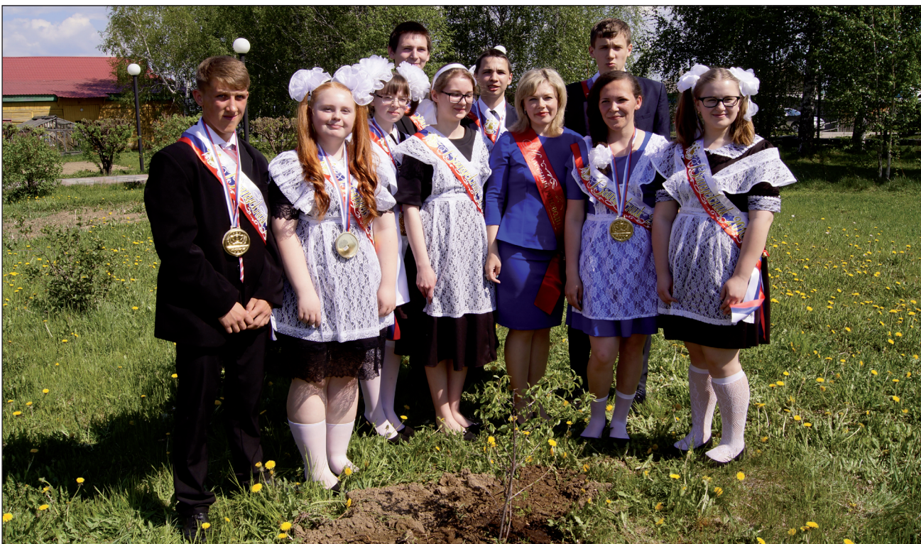
Выпускники вместе с любимым учителем посадили дерево в школьном саду.