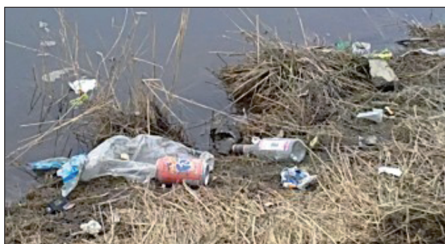
Таким видом часто встречает нас место отдыха.