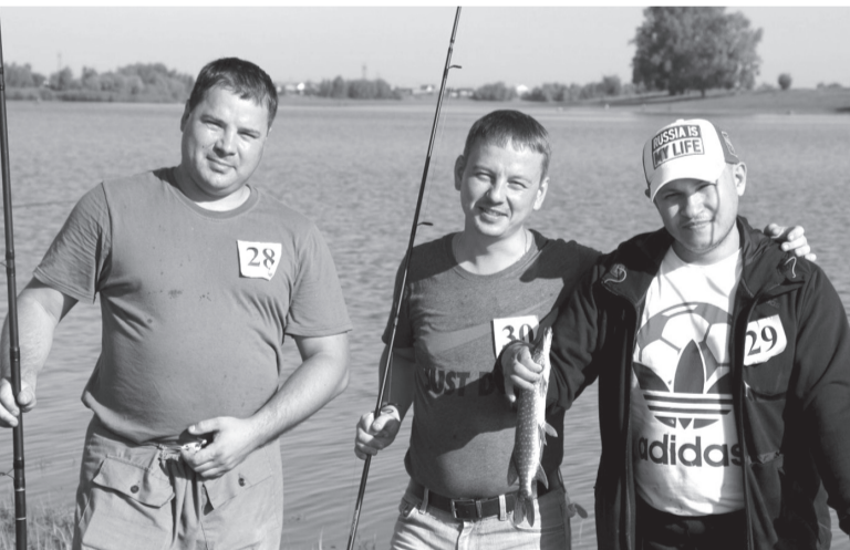
В минувшие выходные состоялась традиционная корпоративная рыбалка предприятий тобольской промплощадки.