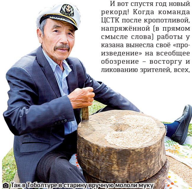
Так в Тоболтуре в старину вручную мололи муку