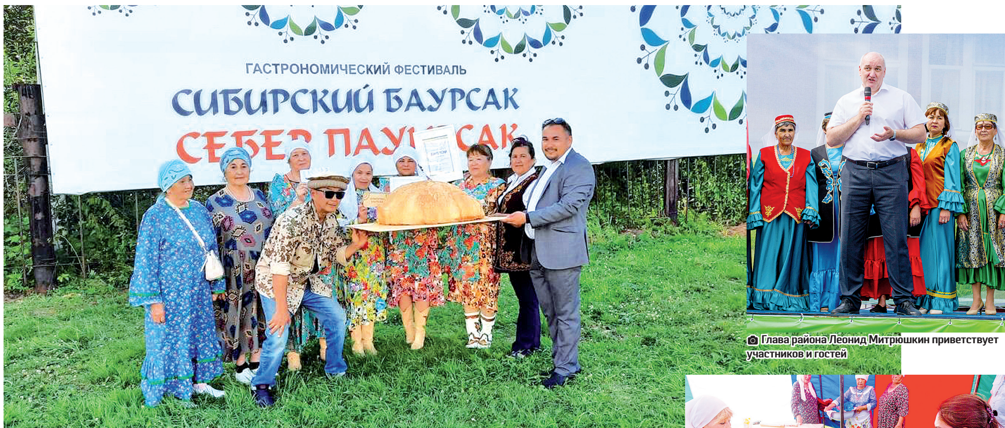
Глава района Леонид Митрюшкин приветствует участников и гостей