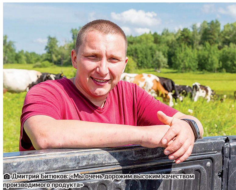
© Дмитрий Битюков: «Мы очень дорожим высоким качеством производимого продукта»

Обратили внимание, что на лугу мало гнуса, в чём тоже заслуга местных животноводов. Прежде чем выгнать животных