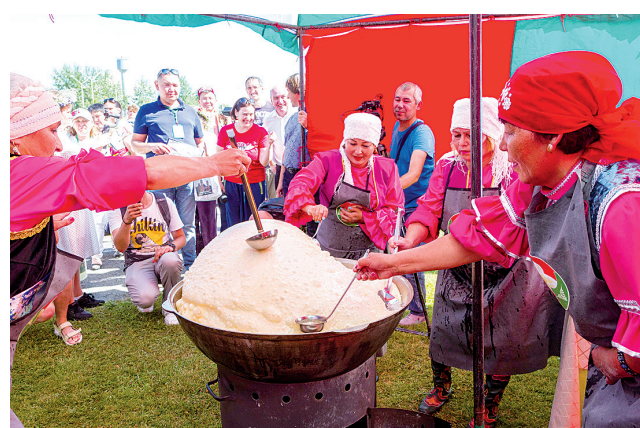
У баурсаков своя непростая технология приготовления