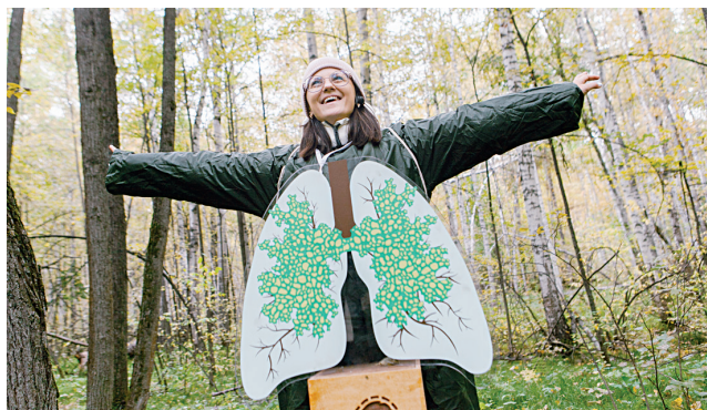
Тут и лобарии дышится легко

– Примеров, когда промышленные компании, как в данном случае СИБУР, вкладываются в создание