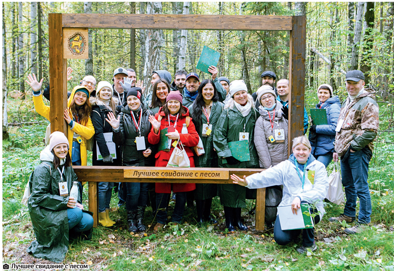
Лучшее свидание с лесом

Нацпроект «Экология». Главное правило экотропы: никогда не сходить с экотропы. Так посетителей экологических маршрутов, проложенных вблизи «ЗапСибНефтехима», учат бережно и со вниманием относиться к природе