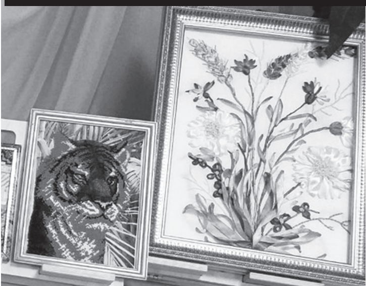
Каких только работ не создают юные мастера-умельцы