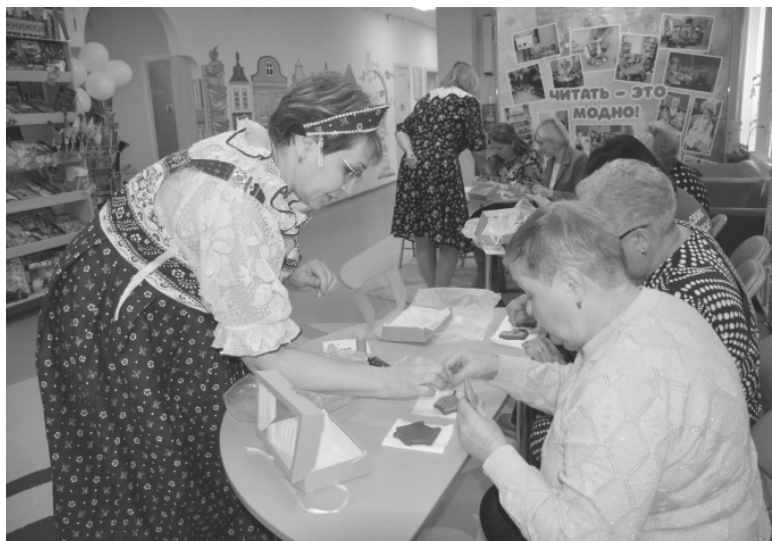
Педагоги предложили всем участникам создать вкусные пряники