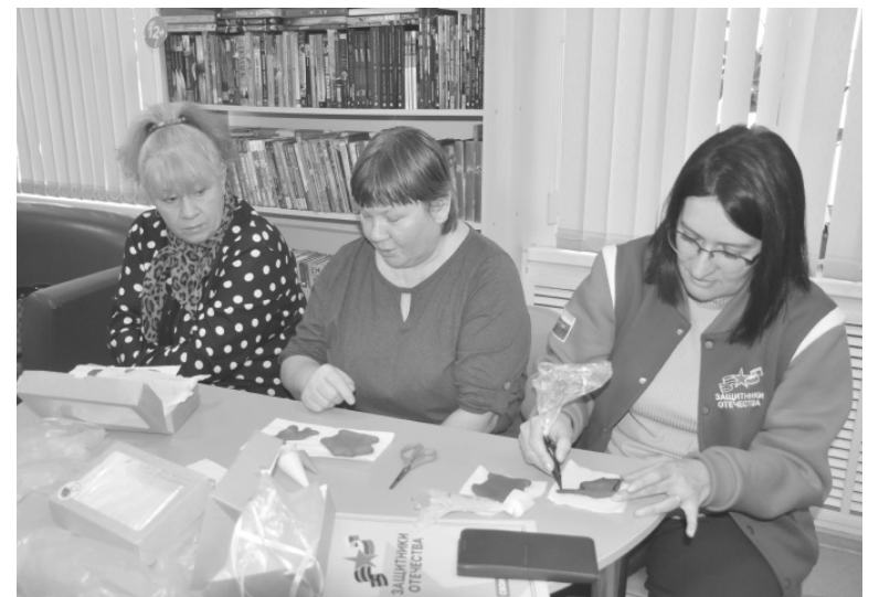
Буквально за полчаса были готовы сладкие подарки