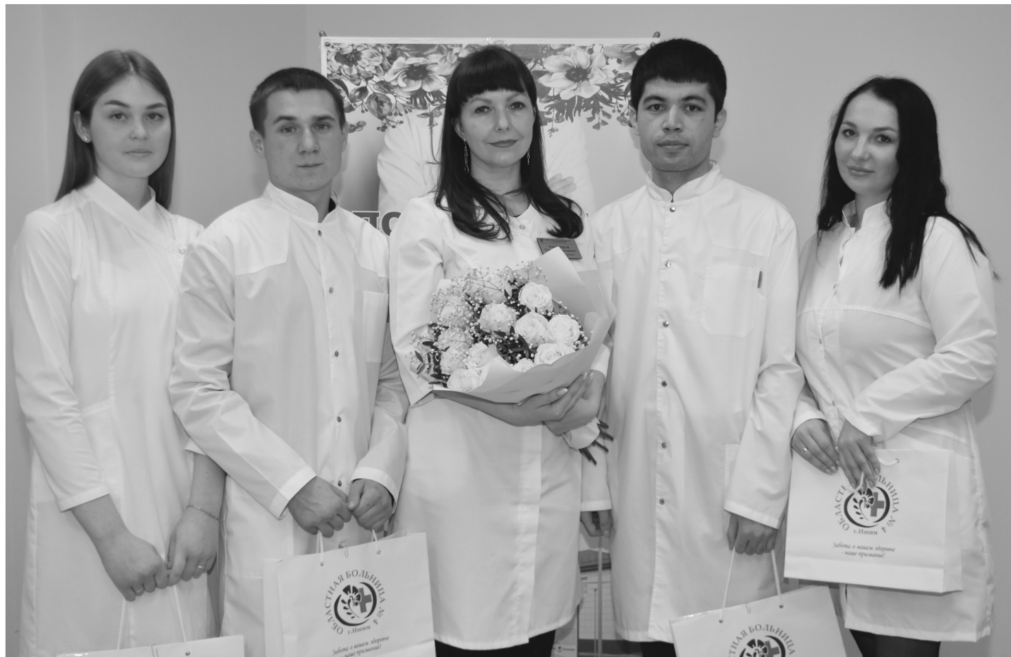
Медицинские сестры, медбрат и врач-терапевт приступили к работе под руководством своих наставников