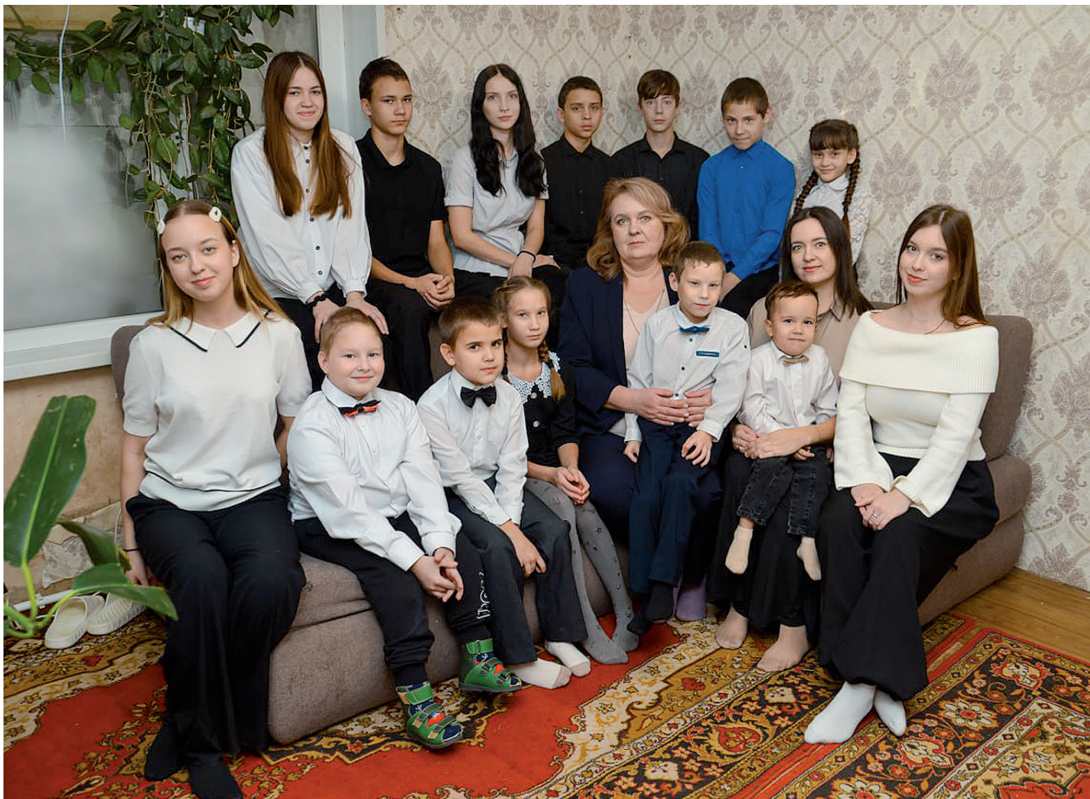
► Семья Зубовых.