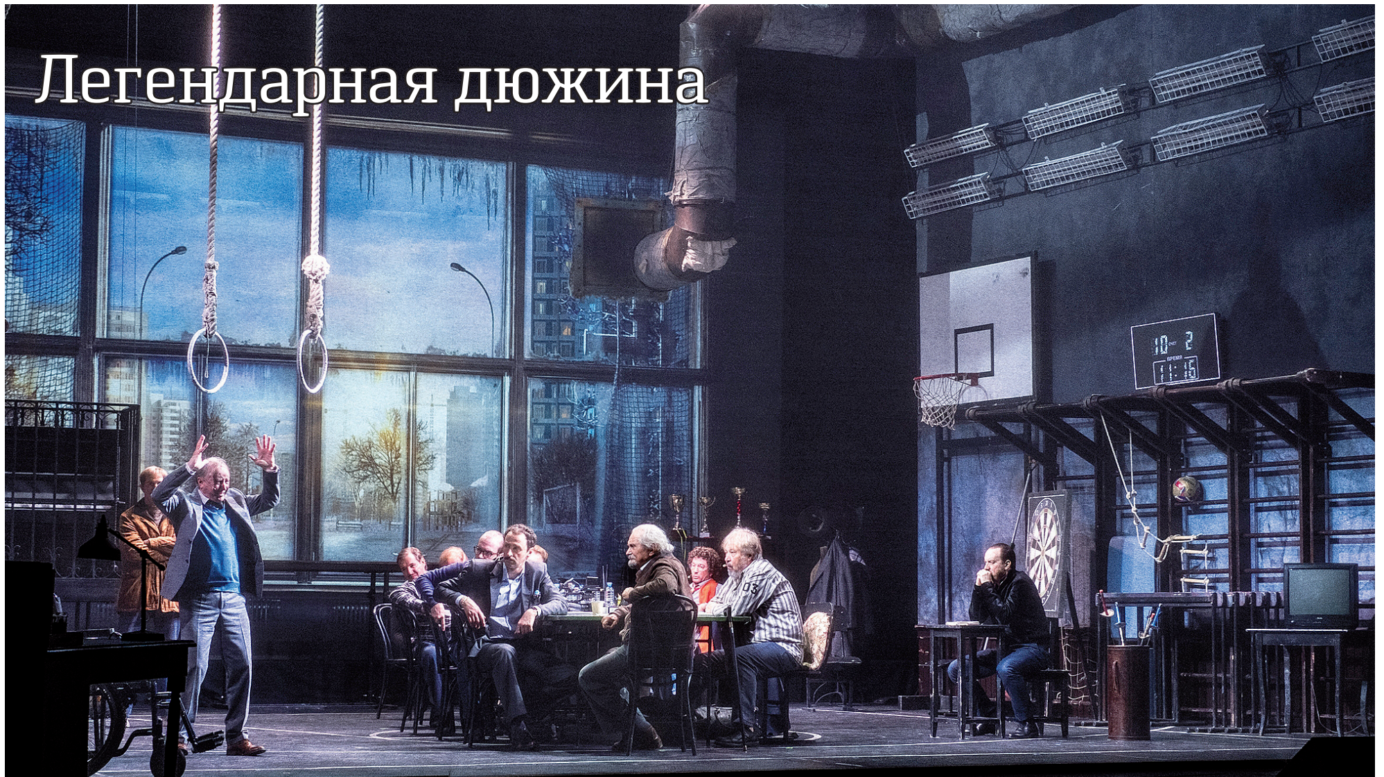
► Свою сценическую жизнь спектакль «12» начал в 2021 году. В роли 12-го присяжного – Николай Бурляев (под кольцами), восьмого присяжного – Никита Михалков (во главе стола)