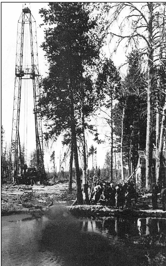
Шаим. Сквжина Р-6. 1960 год.