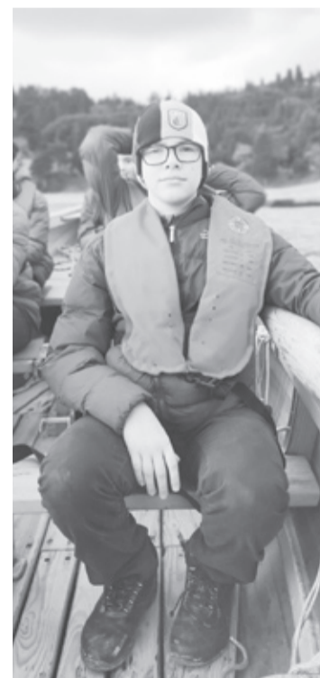
|| Фото из личного архива Николая Макарова

Школьник говорит, что свободного времени у юных моряков не было. Мальчишки и девочки изучали азбуку Морзе, строение и вооруже-