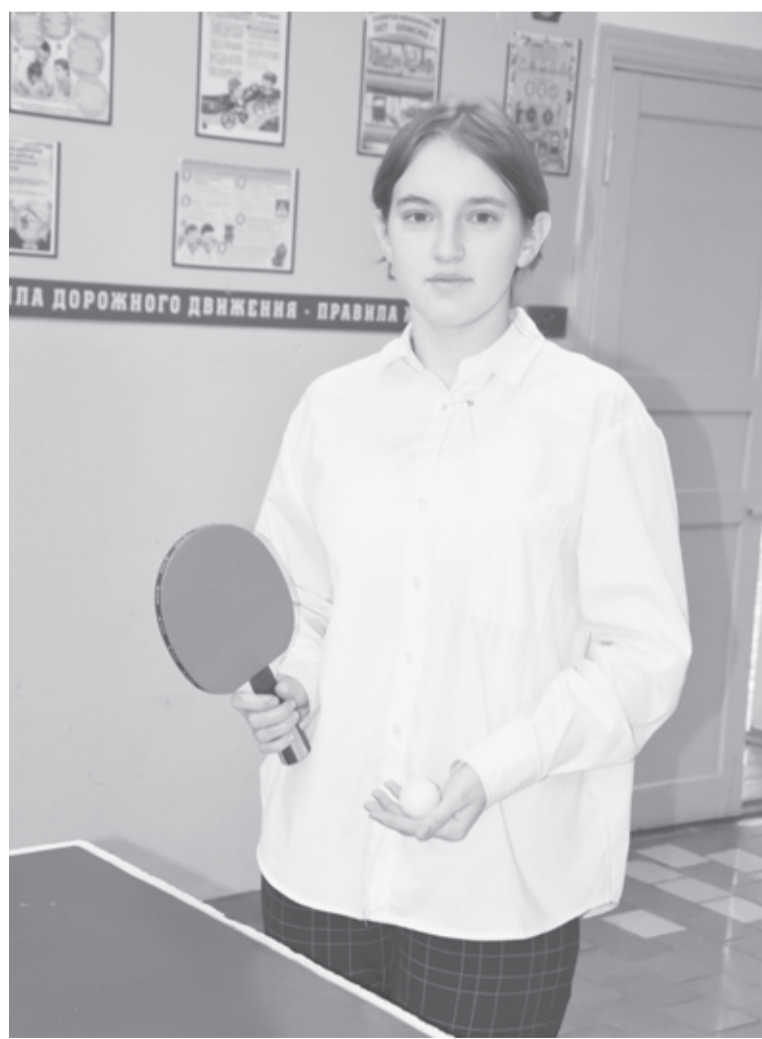
|| Фото автора

Анна признаётся, что спорт стал для неё образом жизни, и будущую профессию она хочет связать с ним.