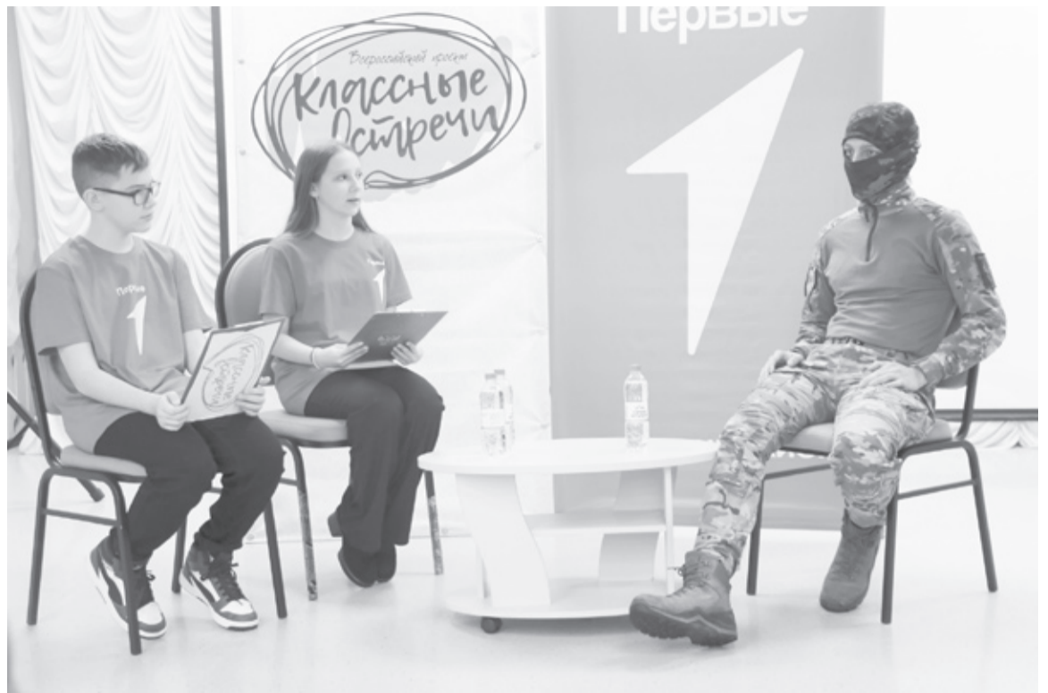
|| Фото автора

– Он пришёл ко мне в первый класс шестилеткой. Очень