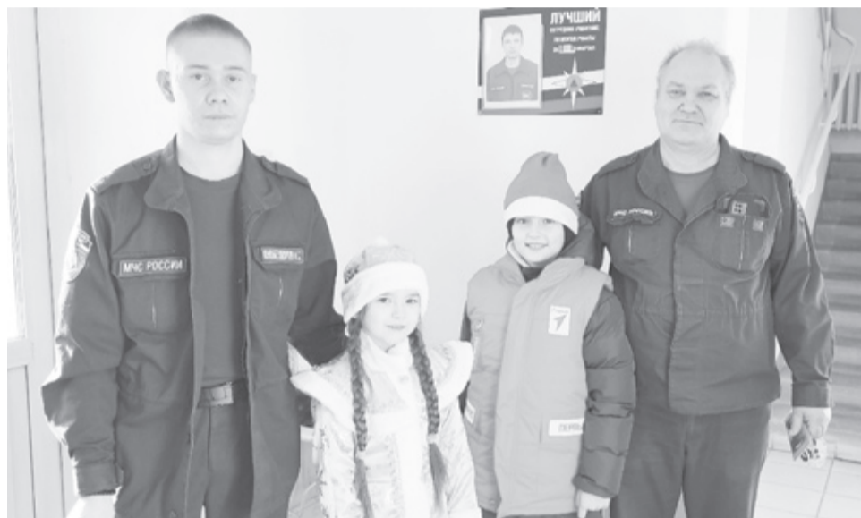
||Фото из архива первой школы райцентра

– Прийти поздравить с наступающим праздником, спеть песню, прочитать стихотворение, вручить подарок – несложно, но очень приятно тем, кто Новый год вынужден встречать на работе, – уверены волонтеры.