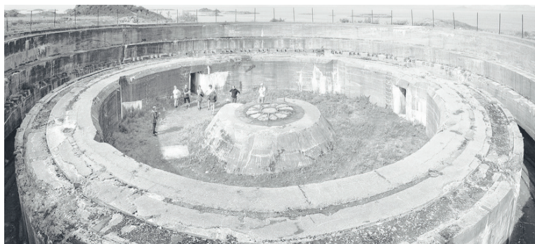
То, что успели построить советские военнопленные на «острове Ангела».

С августа 1941 и до мая 1945 года в оккупированной немцами Норвегии находилось более 100 тысяч советских военнопленных. Они находились в 500 лагерях для советских военнопленных. Рабский труд использовался на строительстве дорог, аэродромов, защитных сооружений с моря, железной дороге. На севере Норвегии советские военнопленные строили Полярную железную дорогу. По ней Гитлер планировал отправлять немецких солдат и технику, чтобы зайти и захватить Россию с севера. Норвежские историки говорят, что более 14 000 советских военнопленных навсегда остались лежать в Норвегии. Половина имен погибших до сих пор неизвестна».