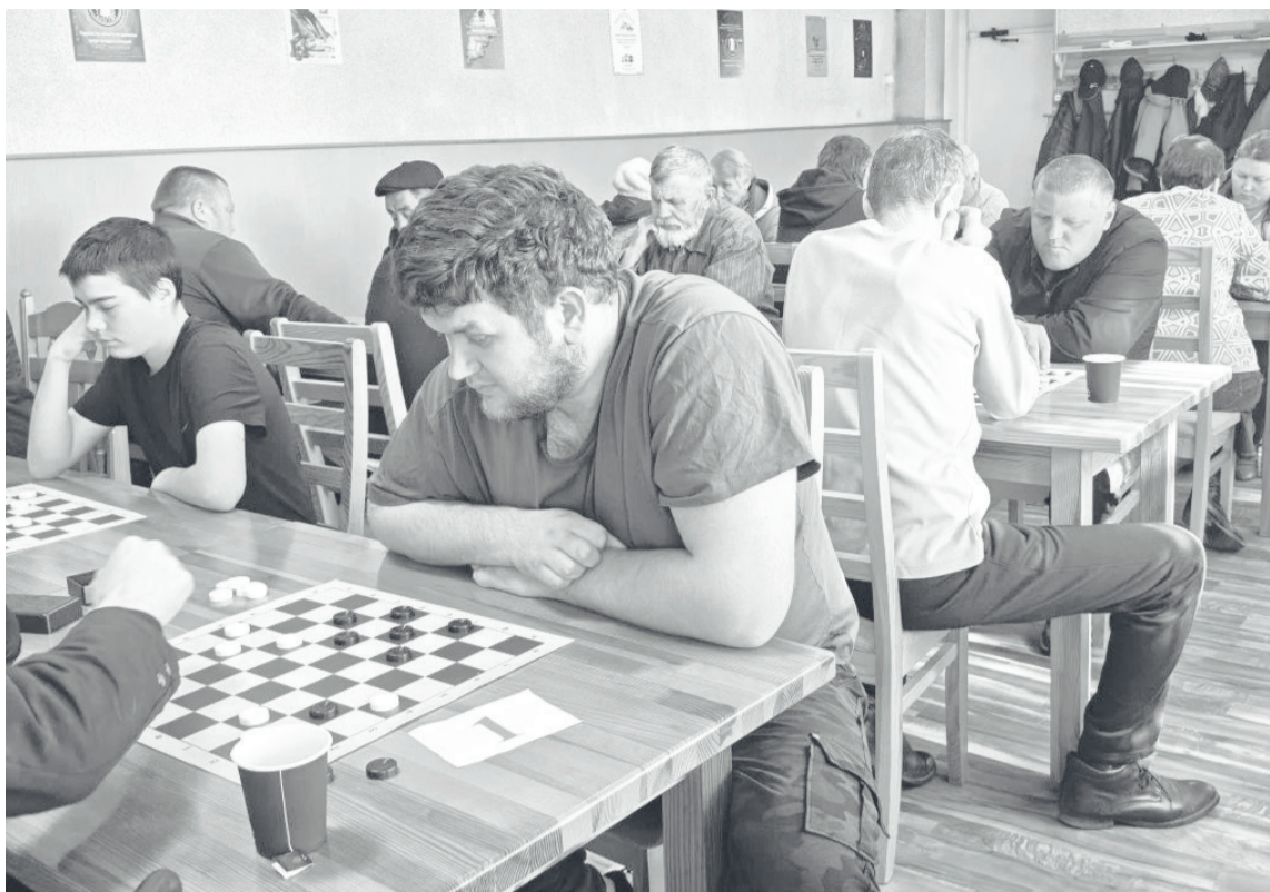
Люди с ограниченными возможностями здоровья сосредоточенно играют в русские шашки.

ть место, проявив себя как настоящий боец. Он достойно противостоял лидерам и завоевал уважение своей настойчивостью и жадой победы.