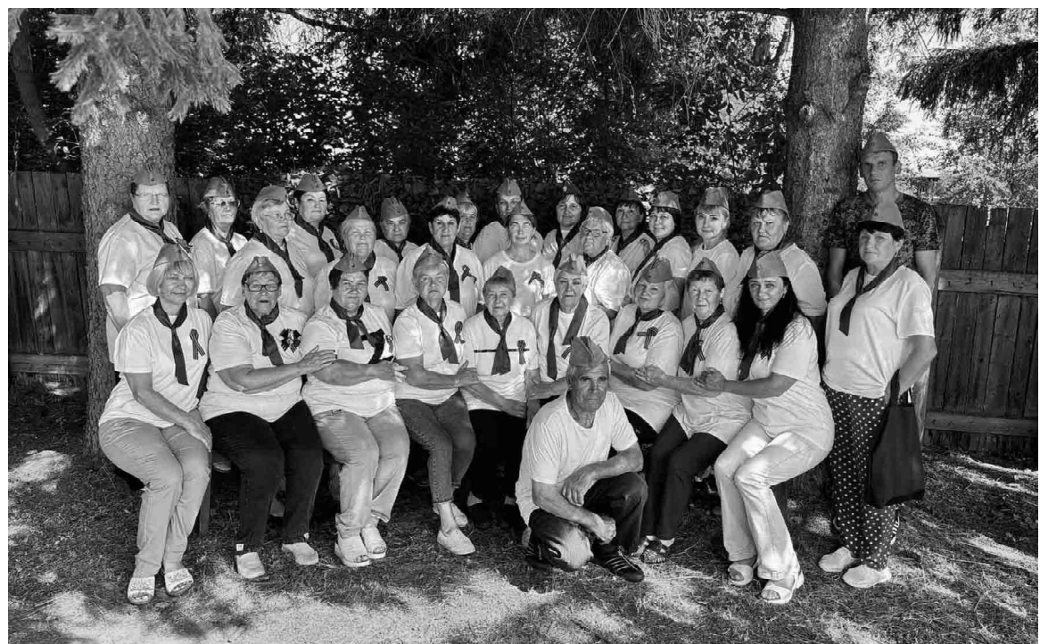
Добровольцы из группы «Поможем Нашим все Вместе» делают все возможное, чтобы уберечь жизни воинов

Анжелика ПАЙВИНА