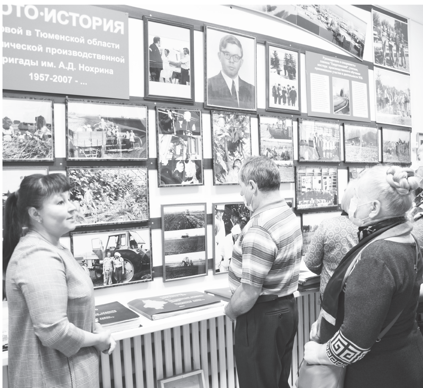
В школьном музее накоплен богатый краеведческий материал о территории и людях, которые внесли большой вклад в её развитие.