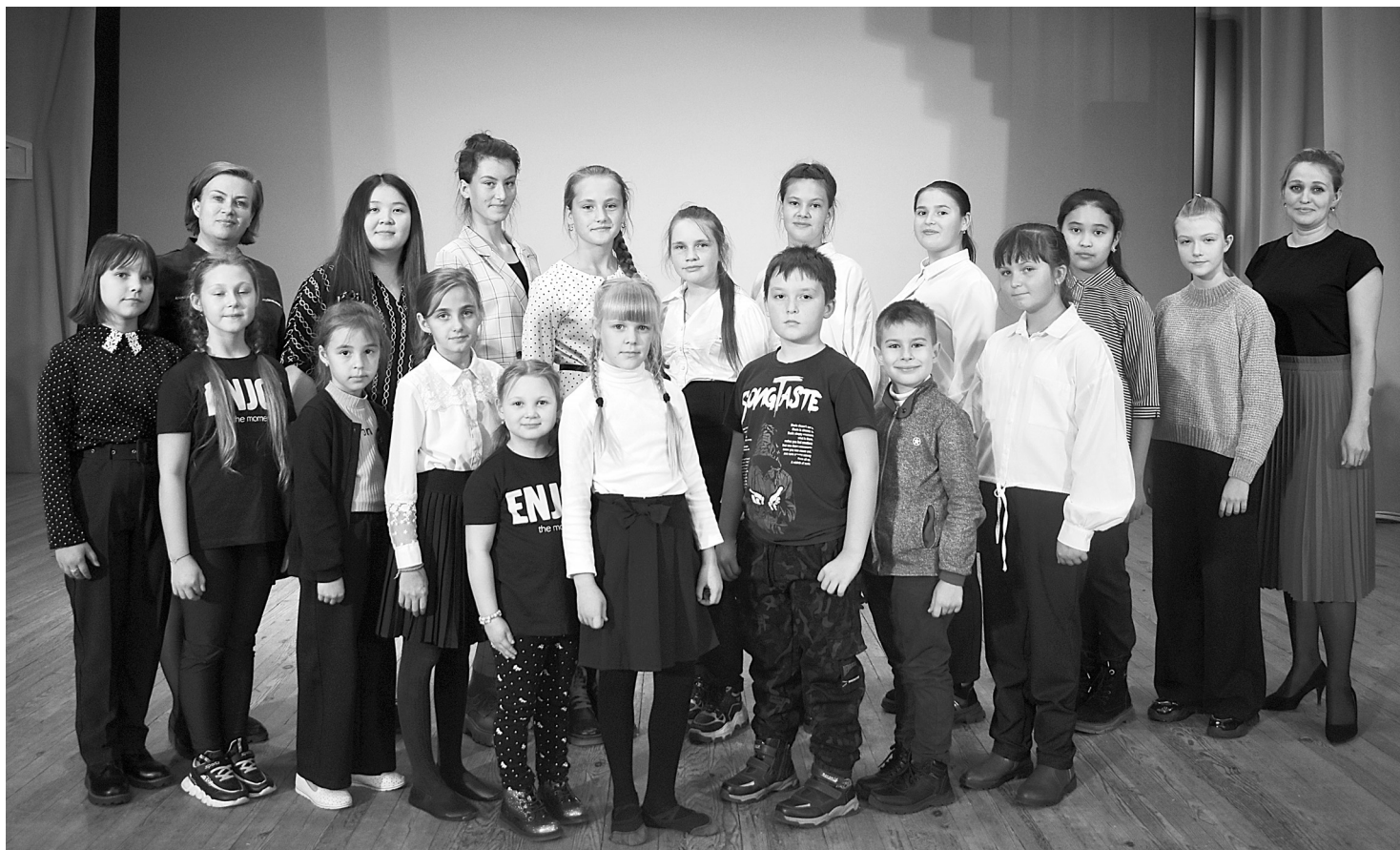
Ребят объединила любовь к песне и творчеству. Для большинства из них это просто увлечение, но некоторые хотят связать свою жизнь со сферой культуры