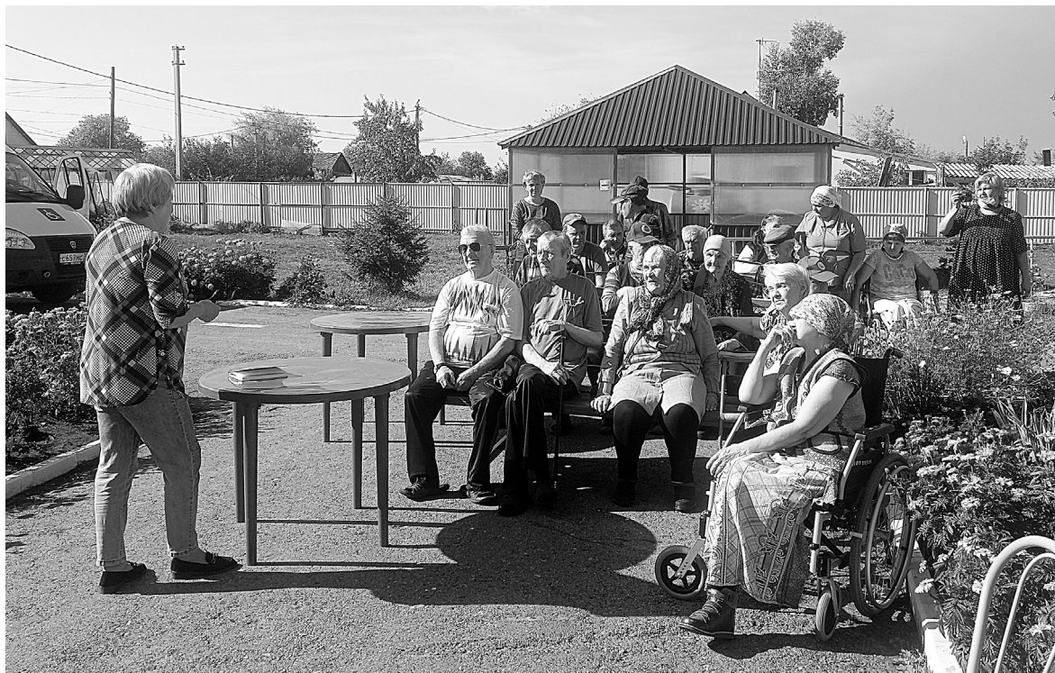
Встреча в Истошинском Доме-интернате прошла на свежем воздухе. Звучали добрые песни, пожелания и советы по долголетию