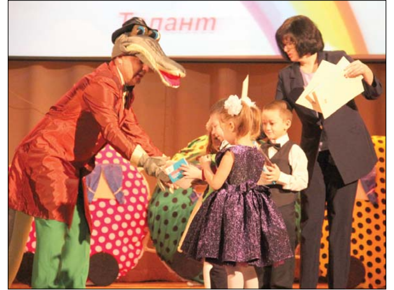
• Юные артисты по итогам фестиваля получили награды.