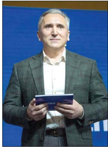
• Глава региона открывает Дни Тюменской области на выставке-форуме в Москве.

Более подробно читайте в следующем выпуске газеты.