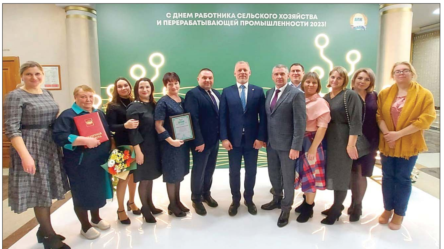
• Аромашевцы побывали на областном Дне работника сельского хозяйства.