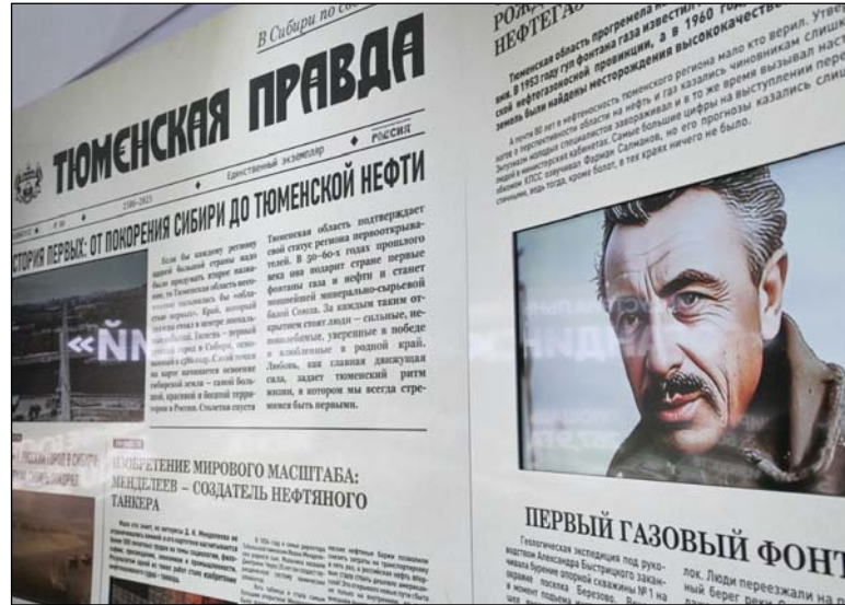
• Один из стендов на выставке.