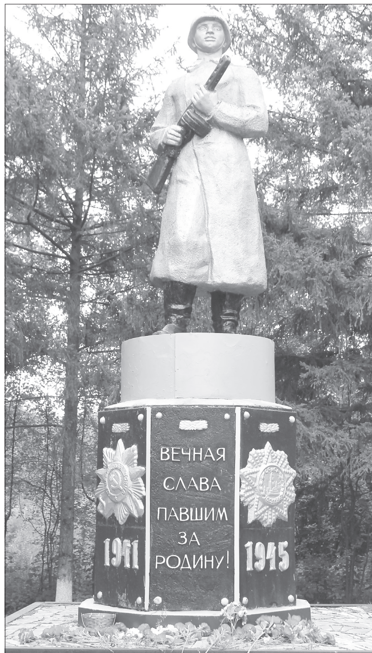
В течение года молодые люди, приезжающие в гости к родителям, приходят к памятнику и фотографируются