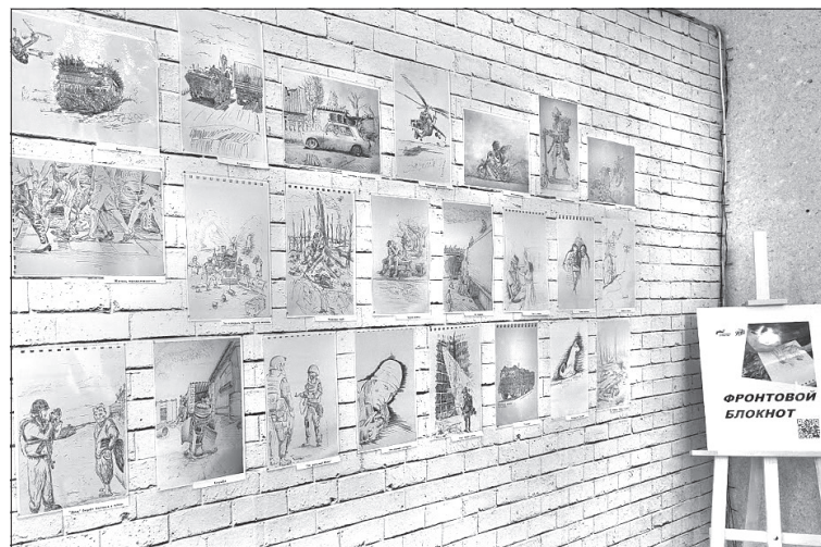
Рисунки Евгения в буквальном смысле пропахли порохом

мере, здесь она предстаёт зрелым мастером - фотохудожником-портретистом, которому удалось заглянуть в глубины душ своих персонажей. Многие поэты и философы в разное время пытались понять и объяснить, что есть женская красота, и не у всех это получилось. Так вот, здесь тот самый случай, когда всё срослось. И место нашим красавицам (судя по портретам, это не может подвергаться сомнению) где-нибудь в Третьяковской галерее.