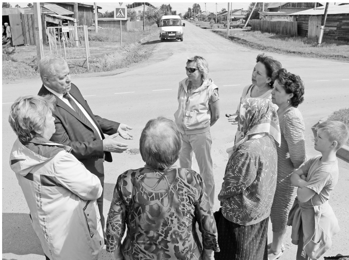
Вот она – дорога по ул. Лермонтова – обновлённая, без рытвин и колдобин.

Общая протяжённость новых улиц составила 3864 метра, стоимость – 27 млн. 166 тысяч, – поделился информацией ин-