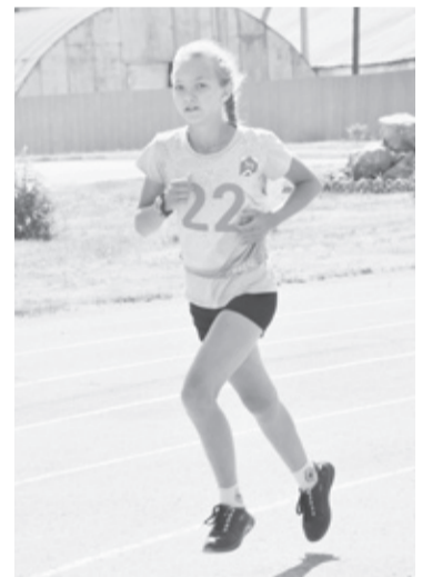
|| Бег на 1500 метров