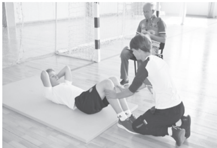
|| Поднимание туловища из положения лёжа.