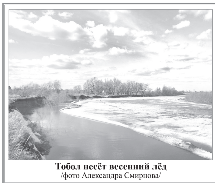
Тобол несёт весенний лёд

А рано утром пришёл «уазик» и меня со стариком увёз. Я был доставлен, можно сказать, до дома.