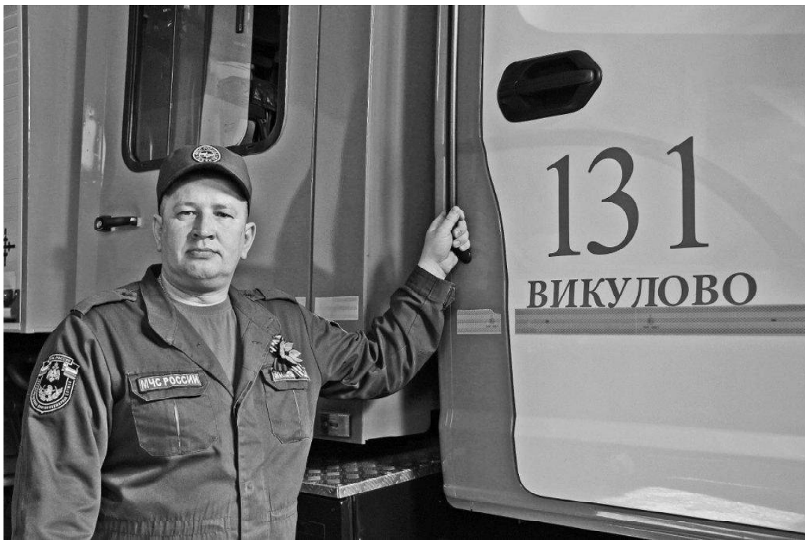
› Евгений Знаменщиков // Фото автора