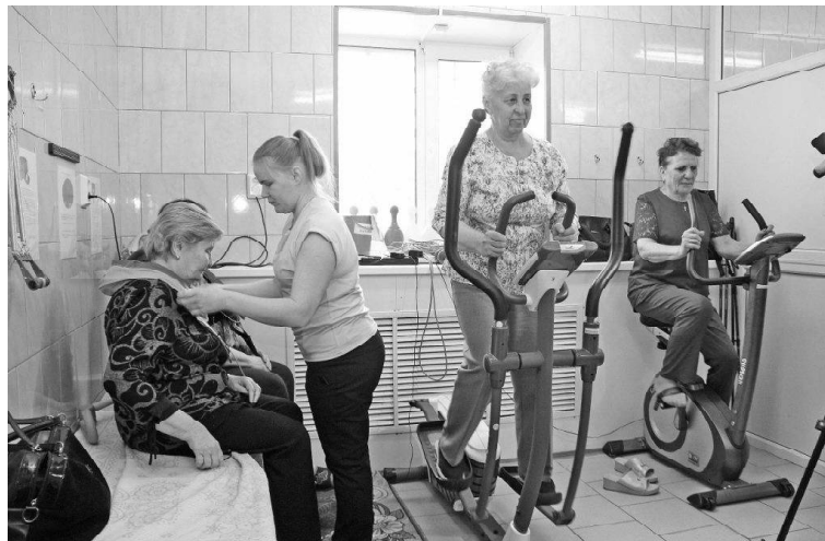
➤ Спортивные и оздоровительные процедуры

Одной из основных форм работы Комплексного Центра социального обслуживания населения является предоставление гражданам пожилого возраста и инвалидам услуг социальной реабилитации. Это комплекс мер, направленных на восстановление способностей человека жить в обществе, улучшение качества жизни и эмоционального благополучия.