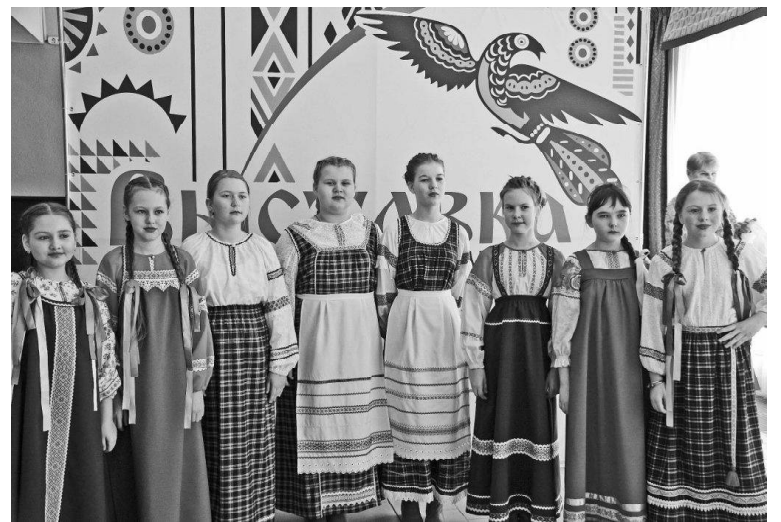
› ВА «Первоцвет»

В зале фестиваль продолжили вокальные и танцевальные ансамбли Викуловского района. Почти три часа аплодировал зал, тепло встречая артистов. Песни новые и старые, стихи и танцы – всё это было на сцене. Более 40 номеров представили зрителям художественные коллективы. Отрадно, что на сцене вместе со взрослыми выступа-