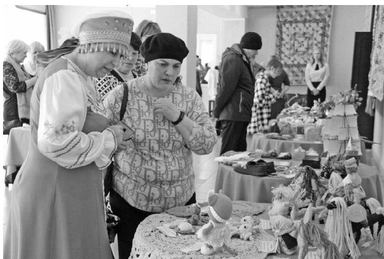
› На выставке