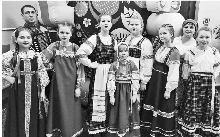
Участники конкурса из Викулово