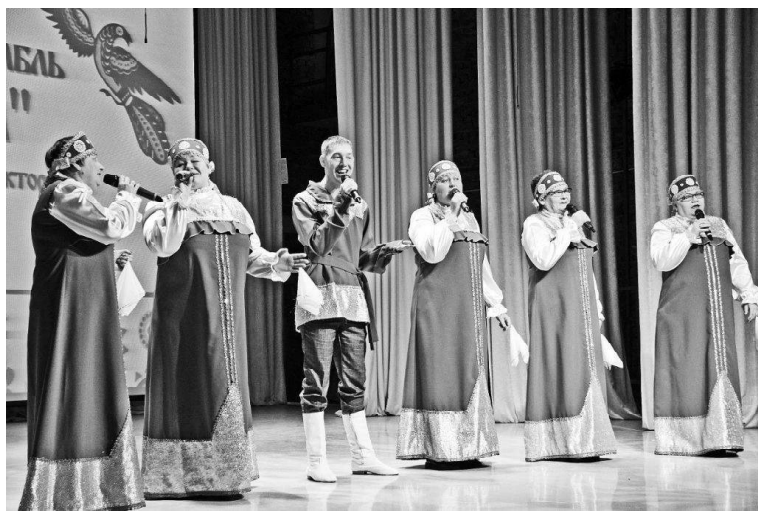
› Коллектив с. Березино

Как говорится, было чему порадоваться, что посмотреть. Репертуар, костюмы – всё участники продумали, подготовились. Ежегодный фестиваль «Живые родники» собирает на