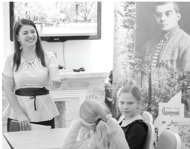
В детской библиотеке всегда есть посетители: сюда приходят дети с родителями, подростки, целые классы – выбрать книжку по душе или на познавательные мероприятия.

детей стали меньше читать. По-прежнему обращаются за произведениями школьной программы, читают много развлекательной литературы. Бывает, что где-то увидели рекламу книги, заинтересовались. Даже если у нас такого издания нет, всегда посоветуем что-то похожее, чтобы ребенок не ушел с пустыми руками. Часто после мастер-классов и мероприятий берут книги, о которых шла речь.