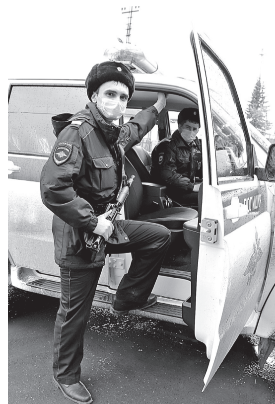
• Заводоуковские полицейские теперь работают в масках и перчатках.

Алексей СЕВОСТЬЯНОВ