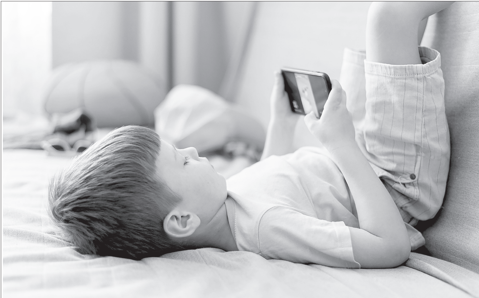
Продуманная стратегия киберзащиты детей делает их цифровой мир безопасным.

А вот и результат. В 2019–2021 годах действовала молодёжная группировка «Белая», занимавшаяся мелким воровством и вымогательством. Их относят к последователям неформального движения АУЕ (запрещённая в России экстремистская организация). Они открыто рассказывали о своей деятельности в соцсетях, выкладывали видеоролики с избиванием подростков. При этом старшие члены злобной бригады нацеливали своих протеже на постоянное расширение круга участников. 11 августа 2021 года Набережночелнин-