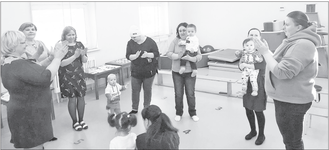
Идёт пятое занятие в школе молодого родителя.

Это уже не первое заседание школы, и многие родители посещают их регулярно, знакомясь с деятельностью детского сада. Первые четыре были посвящены организационным вопросам, роли игры в семейном воспитании,