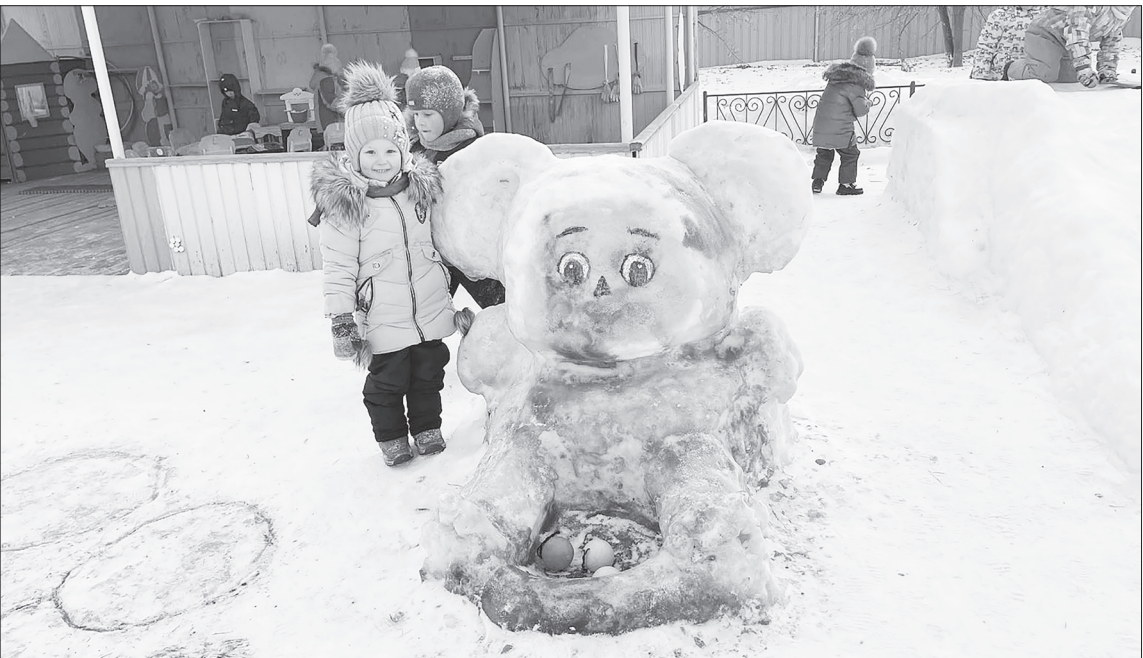
Вот такая ледовая красота создана воспитателями и родителями детского сада «Колосок».

Итоги конкурса «Зимняя сказка» подводили в каждом