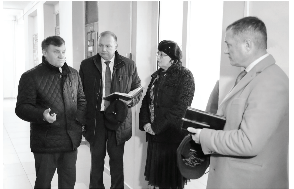
Школы города Ишима приводят в нормативное состояние. Ремонт зданий запланирован на 2024–2025 гг.

– В городе уделяется пристальное внимание сфере образования, – сказал Федор Борисович. – Начали приводить в нормативное состояние детские сады,