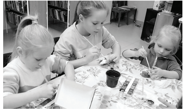
В библиотеках Ишима всегда можно интересно и с пользой провести время.

УВАЖАЕМЫЕ ЧИТАТЕЛИ! ПРОДОЛЖАЕТСЯ ПОДПИСКА на газету «Ишимская правда» на первое полугодие 2024 года. Цена комплекта – 779 руб. 46 коп., подписка в редакции – 216 руб. 00 коп.