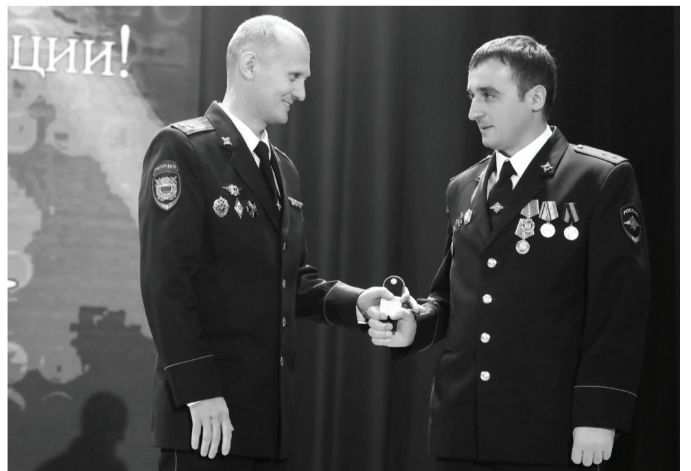
Закон и порядок – основа стабильного развития современного общества, на их страже каждый день стоят сотрудники полиции.