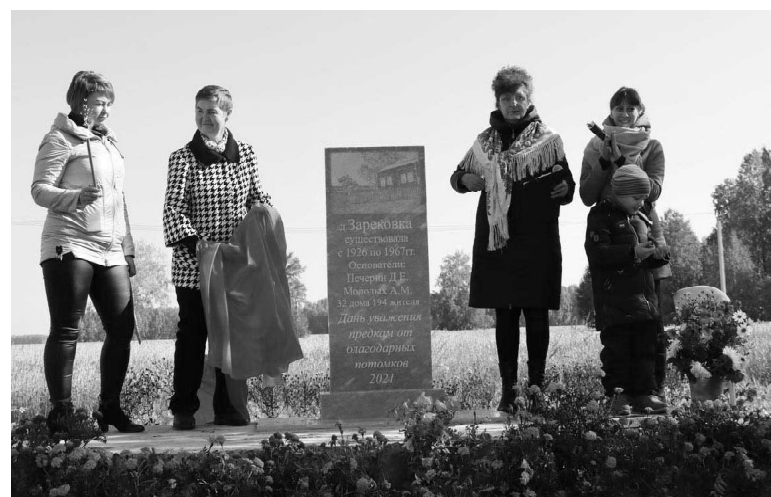
Потомки основателей деревни Зарековка на открытии памятника