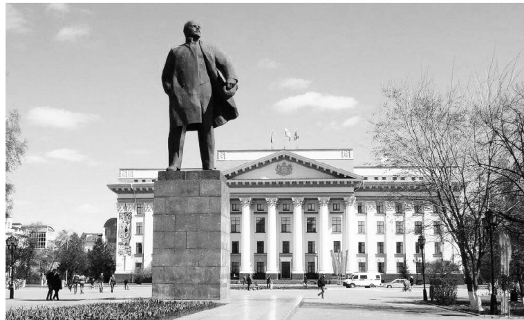
► Памятник В. И. Ленину в Тюмени

В 1972 году принято постановление об организации на базе