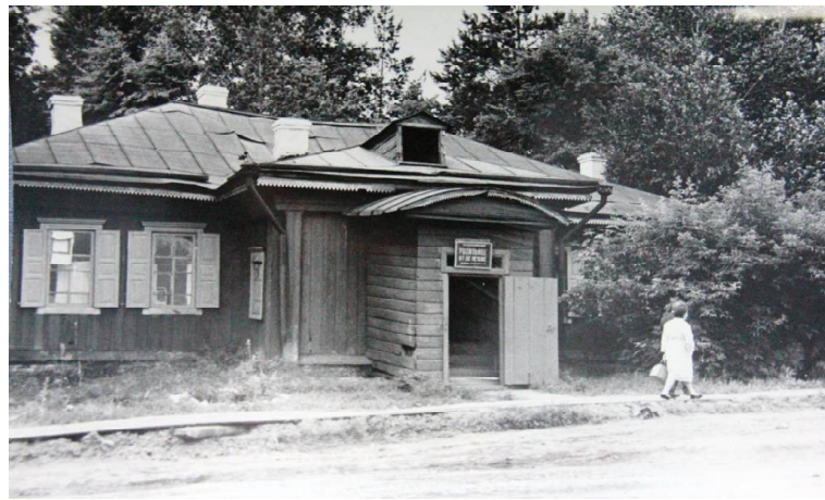
► Родильное отделение в Викулово в 80-е годы

В 1971 году – 9 совхозов и колхозов, районный центр подключили к государственной энергосистеме. В этом же году начался мон-