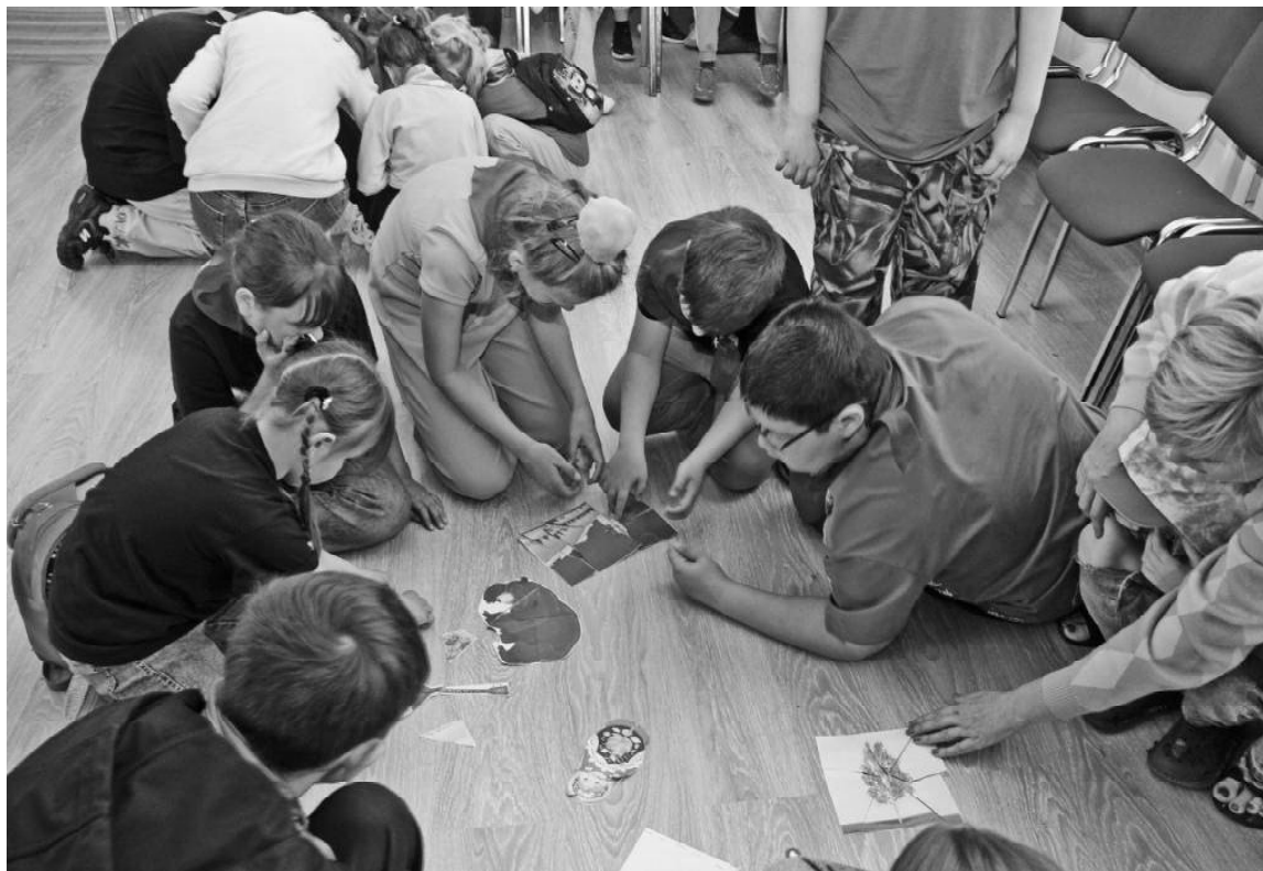
➤ Лагерь «Солнцеград» в Викуловском Центре творчества. Мероприятие «По стопам Петра I»

Всего было сформировано три отряда: «Машина времени», «Пиратская банда», «Мы из будущего». Ребята были участниками таких крупных встреч, как День русского языка, приуроченного ко Дню рождения гения Александра Пушкина, «По стопам Петра I» ко Дню России и других. На протяжении всей сме-