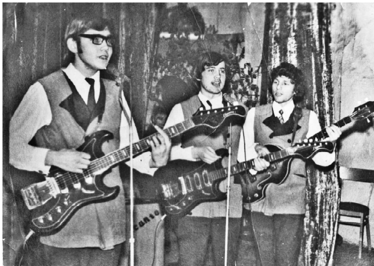
► ВИА «Романтики»

таж телевизионной вышки. Появилось телевидение.