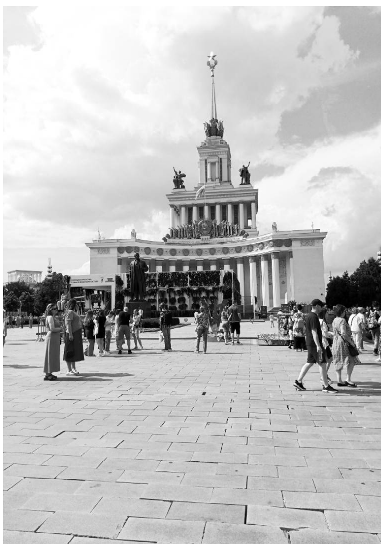
➤ На ВДНХ в Москве

В наши дни в региональной столице реализуется стратегически важный проект — Межуниверситетский кампус мирового уровня. Кампус площадью более 167 тысяч квадратных метров создаст условия и откроет ещё больше возможностей для интеллектуального и творческого развития молодёжи. Губернатор подчеркнул, что кампус станет новой осно-