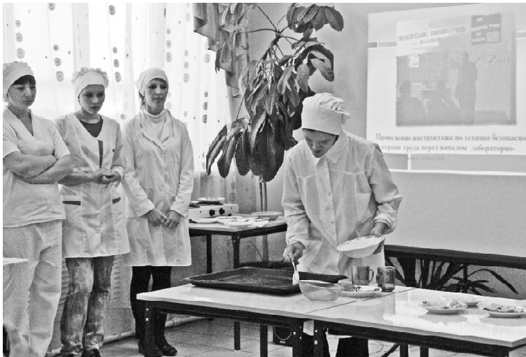
Экскурсию в профессии для выпускников района провели учащиеся ПУ №2.

Пока у ребят есть время взвесить все «за» и «против», такие встречи очень значимы для них. Все профессии важны, все профессии нужны! Кульминационный момент мероприятия — мастер-классы от преподавателей и учащихся.