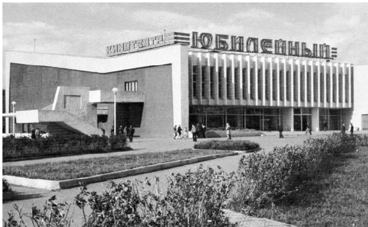
► Кинотеатр «Юбилейный», г. Тюмень

Тюменского педагогического института первого в регионе университета – Тюменского государственного. В окрестностях Тюмени, вблизи деревни Каскара, началась стройка первой очереди крупнейшей в Сибири фабрики по производству мяса птицы, она предусматривала ежегодное выращивание трёх миллионов бройлерных цыплят.