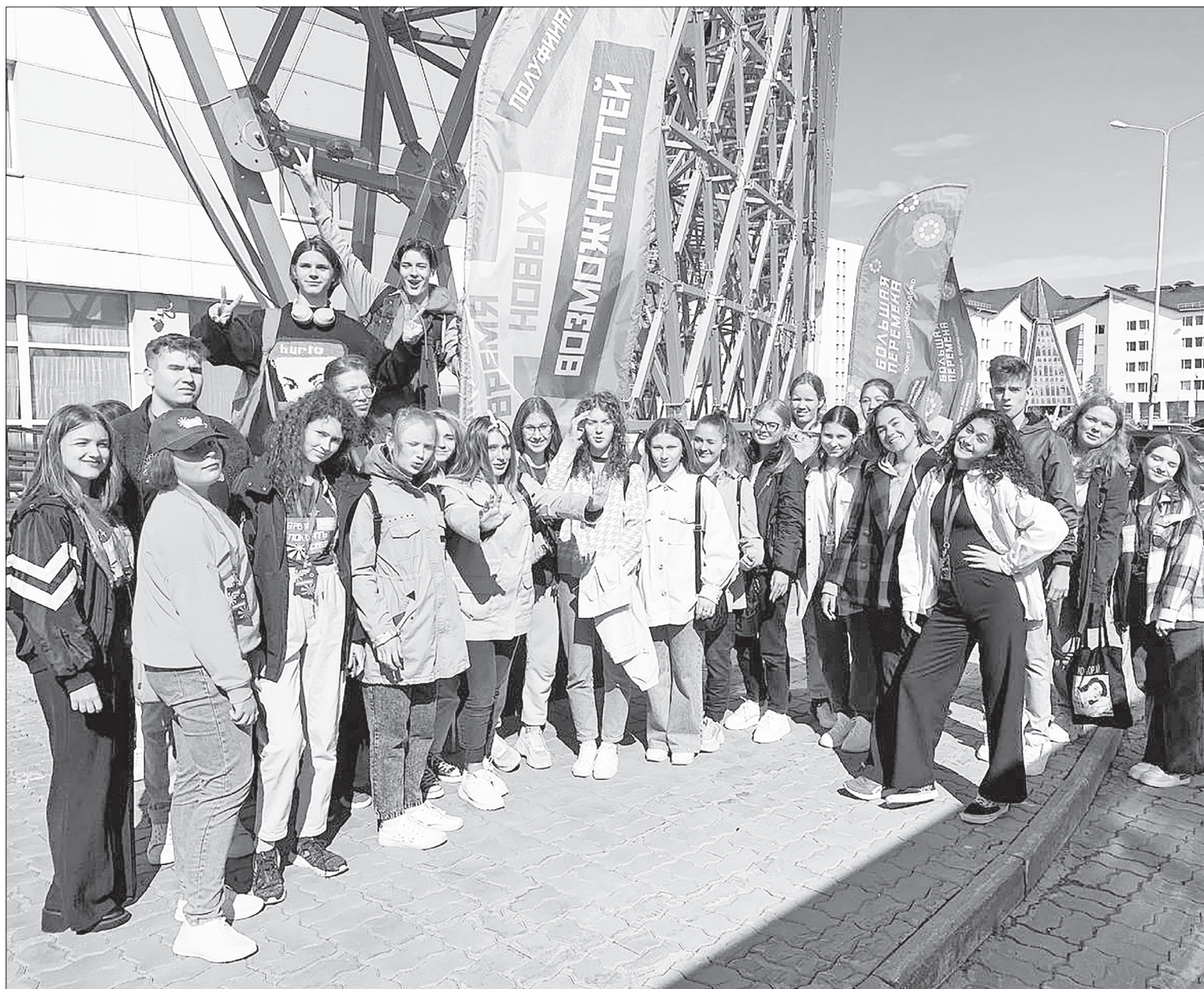
■ Неизгладимые впечатления, новые знакомства, океан эмоций – участники надолго запомнят этот полуфинал.

Большие амбиции. Попасть на третий этап «Большой перемены» – огромное достижение, ведь из 3 миллионов участников в полуфинале оказалось всего 6 тысяч. В прошлом материале на эту тему мы рассказывали подробнее о трудностях предыдущих этапов. Стоит также отметить, что изначально от Нижней Тавды в конкурсе участвовало семь человек. Я поговорил с ребятами,