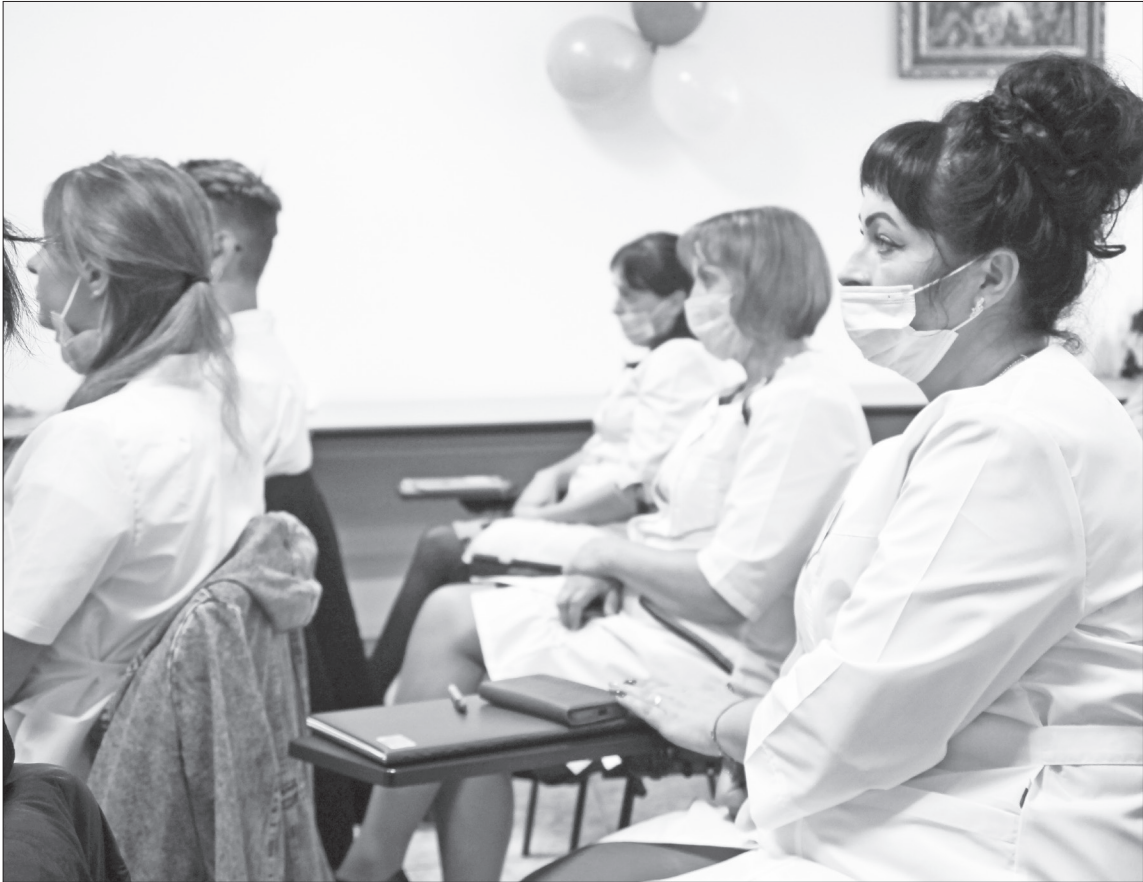
■ Студенты Ялуторовского медицинского колледжа на линейке, посвящённой началу учебных занятий. Это сотрудники Областной больницы № 15: регистраторы, экономисты, санитарки, бухгалтеры. В будущем они станут квалифицированными медиками.

– Учебный процесс организован в вечернее время с 16:00 до 19:30 в дистанционном формате, а практические занятия будут проходить очно на базе нашей больницы. Теоретические уроки записаны. Всем студентам предоставят ссылки, чтобы они могли, не выходя из дома, со своих компьютеров, ноутбуков и других устройств посмотреть лекции. Теоретическая часть за специалистами Ялуторовского медицинского колледжа,