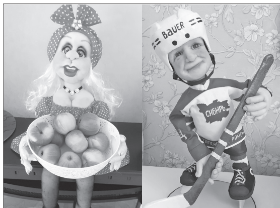
Милые куклы Светланы Мартышкиной из Тюнёво.